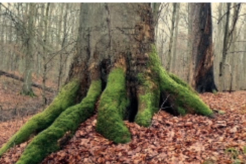
De grootste beuk in het reservaat heeft een diameter van 159 cm en is meer dan 45 meter hoog.