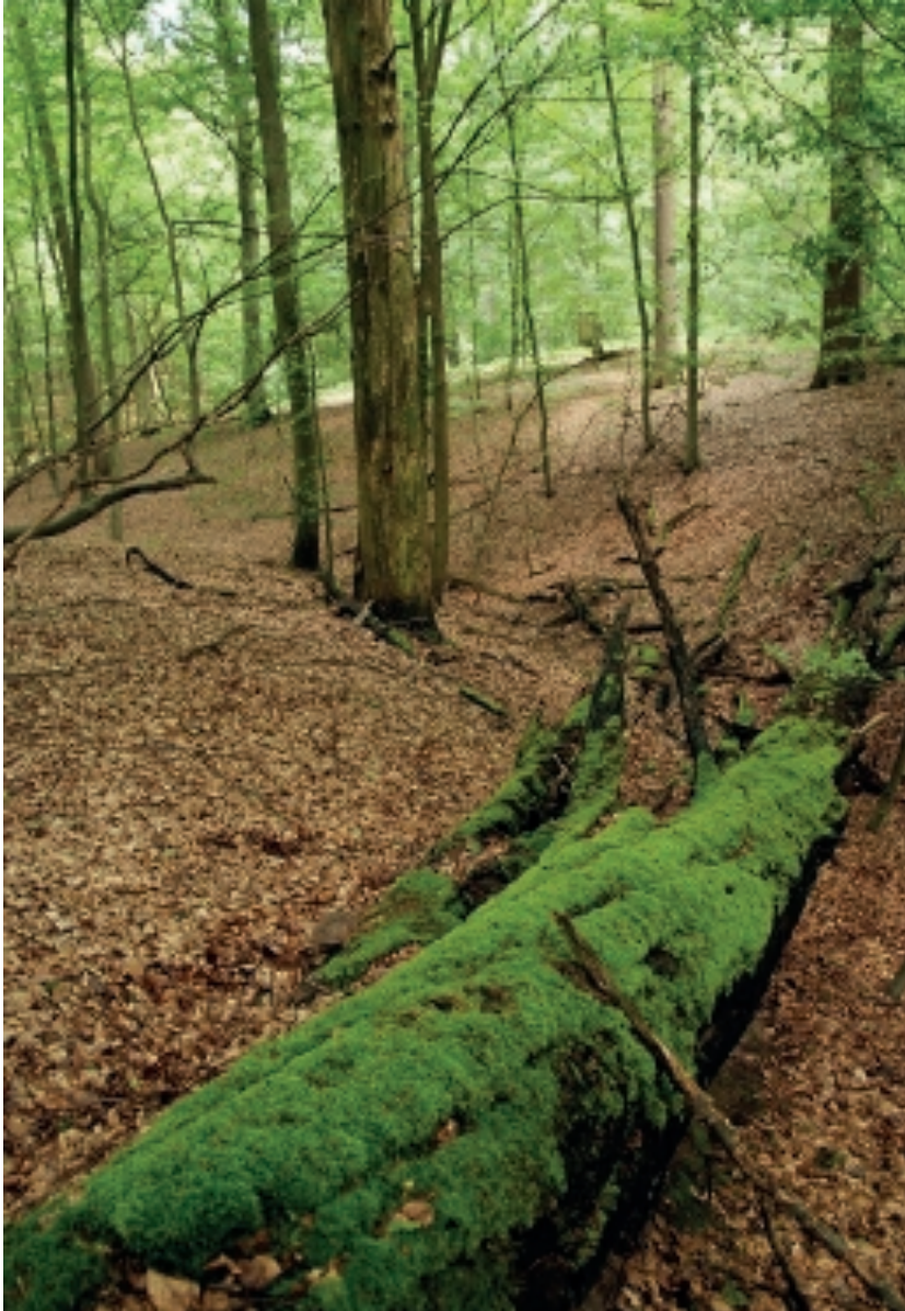
Het oudste deel van het bosreservaat is ondertussen uitgegroeid tot één van de referentiesites voor natuurlijke laagland-beukenbossen, en bevat aanzienlijke hoeveelheden dood hout (foto: Kris Vandekerkhove).

beech forest reference sites, the density of very large trees was generally much lower: between 5 and 20 trees per ha (median 13.1). The trees reached a median diameter of 97 cm (mean 98.9, max 159 cm) and heights of over 45 m, which probably makes them the largest European beech trees in the world.