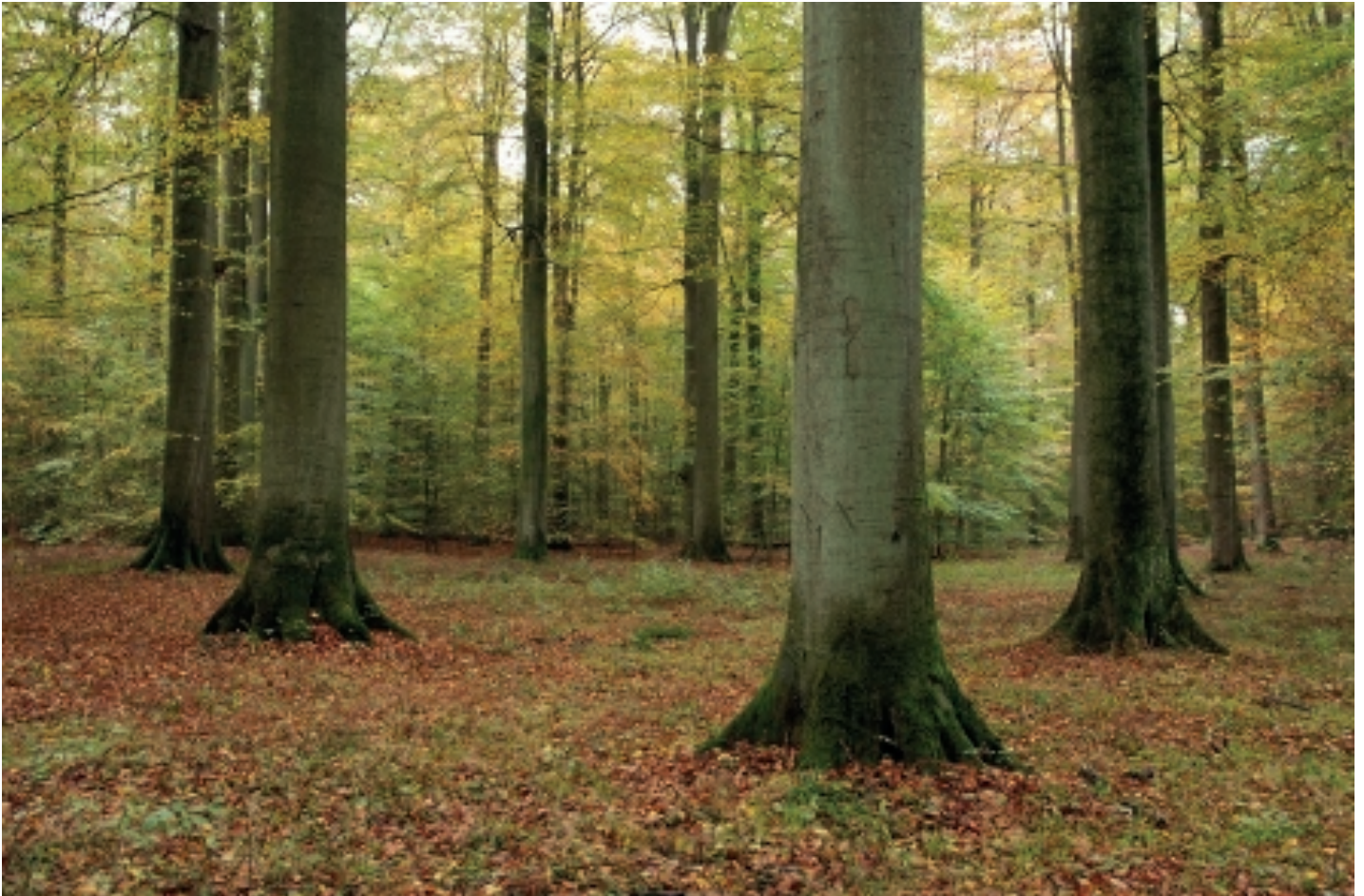
In de onderzochte opstand is de dichtheid aan monumentale beuken hoog.

minder prominent aanwezig zijn in het bosbeeld. Oude bomen die sterven, worden vervangen door kleinere bomen die soms al decennia staan te wachten in de nevenetage. Maar we verwachten niet dat de oude boomgeneratie op korte termijn gaat ineenstorten: omdat de oude bomen nog vitaal zijn, zal de uitval vermoedelijk geleidelijk verlopen en kan gemakkelijk over 100 jaar gespreid zijn. Wanneer de opstand uiteindelijk zijn dynamische evenwichtsfase zal hebben bereikt, zal het bosbeeld misschien minder spectaculair zijn dan nu, met minder monumentale bomen, maar toch nog indrukwekkend.