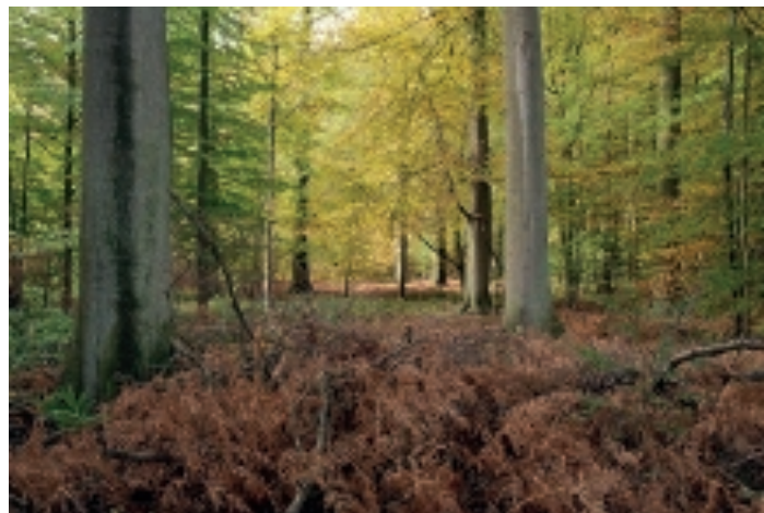
Hoewel de kruidlaag eerder wijst op een zure bodem (zoals deze adelaarsvarens) zijn de diepere bodemlagen rijk aan mineralen. Samen met het hoge waterbergend vermogen van de dikke löss-pakketten zorgt dit voor uitstekende groeiomstandigheden voor beuk.