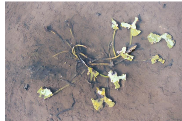
Betreding en vermessing en vraat (J. Packet)