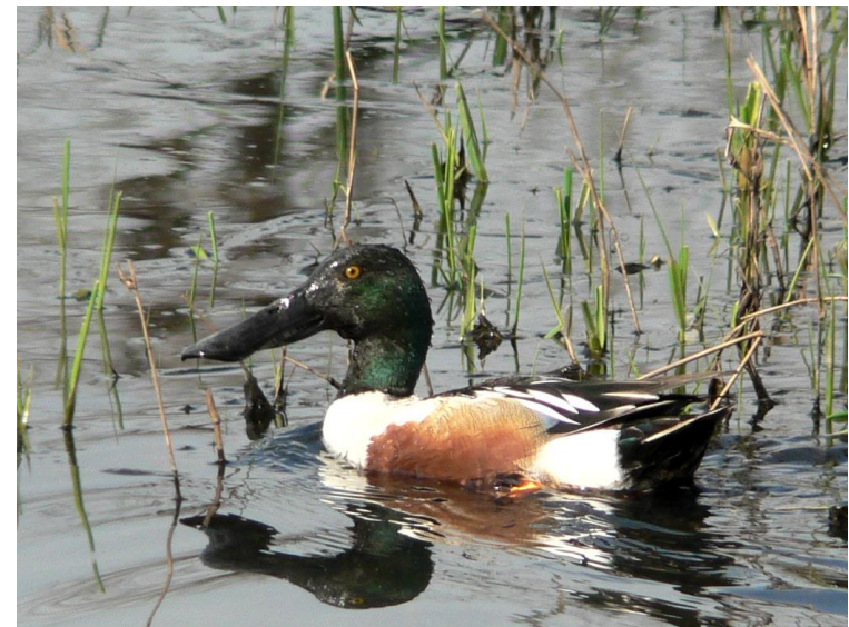
slobeend : doet goed als overwinteraar (andere eenden is een daling merkbaar)