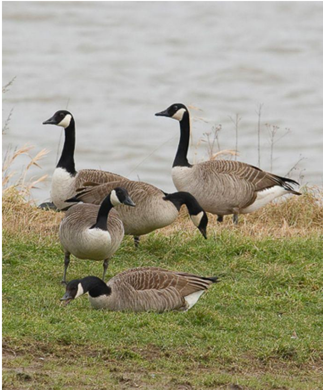
Canadese gans blijft wel de algemeenste exotische gans op de Kraenepoel en maakt vooral gebruik van de strekdam om te rusten of te broeden