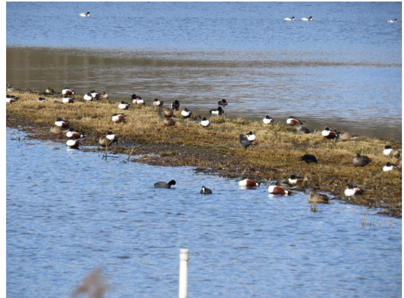
overwinterende en doortrekkende watervogels, foto J Pauwels