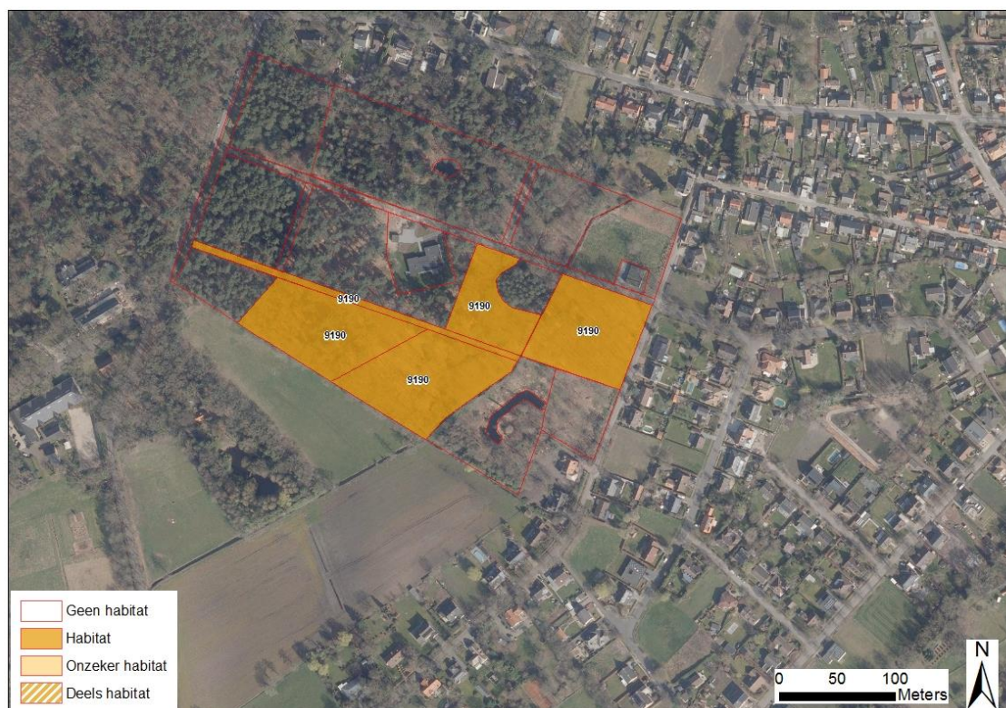
Figuur 3: Situering van de percelen met Natura 2000-habitattypen volgens de geactualiseerde Natura 2000 Habitatkaart van het gebied (Bron INBO: 2022; luchtfoto AGIV 2021)