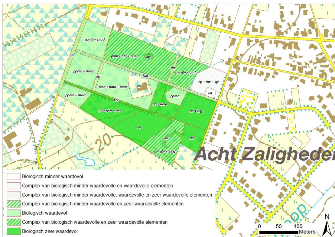
Figuur 2: De geactualiseerde Biologische Waarderingskaart van het gebied (Bron INBO: 2022; belangrijke faunistische waarde: De Knijf et al. 2010; topokaart AGIV 2009)