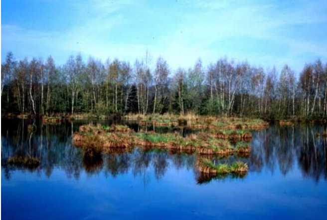
Oude eikenbestanden en de vijvers in de uitbreiding van het bosreservaat Grootbroek.

Voor de inrichting als bosreservaat krijgen de gemeente Büllingen en de privé-eigenaar een jaarlijkse vergoeding van de Vlaamse overheid.