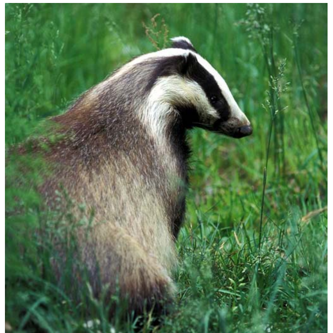
De Das is geen ongewone verschijning in alle Voerense bossen, dus ook niet in de nieuwe bosreservaten

In Turnhout werd vorig jaar het uiterst waardevolle 'Grotenhout' of 'Gierls bos' aangekocht, één van de weinige grote bossen in de Kempen die altijd bos gebleven zijn doorheen de eeuwen. Zowat 80 ha van dit bos wordt als bosreservaat voorgesteld. Ook elders in de provincie Antwerpen zijn een aantal reservaten in het vooruitzicht of zijn onderhandelingen opgestart. In West-Vlaanderen wordt een inhaalbeweging voorzien : niet minder dan 5 dossiers, voor een totale oppervlakte van ca 170 ha, zijn in behandeling. In Oost-Vlaanderen is voor 3 gebieden de procedure lopende : oppervlakte ca 130 ha. In Vlaams-Brabant trachten we momenteel één eigenaar over de brug te trekken, en wordt het voormalige RTT-domein in Liedekerke ook bosreservaat.