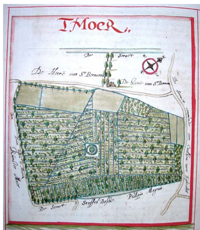
Kaart van het Coolhembos (toen het Moer genoemd) uit het Landboek van Judocus Bal in 1669 (bron: Abdij van Bornem)

Middenin wat nu bosreservaat Coolhembos is, bleek 400 jaar geleden een eendenkooi te liggen. Dit was een constructie om wilde eenden te vangen, bestaande uit een ondiepe vijver of plas met daarop uitmondend vier gebogen vangpijpen, waar de eenden met behulp van tamme eenden en een kooikershondje naartoe werden gelokt. De kooiplas en de vangpijpen werden omgeven door een groenscherm en een afsluiting van rieten matten. Aan het einde van de vangpijpen bevonden zich vanghokjes.