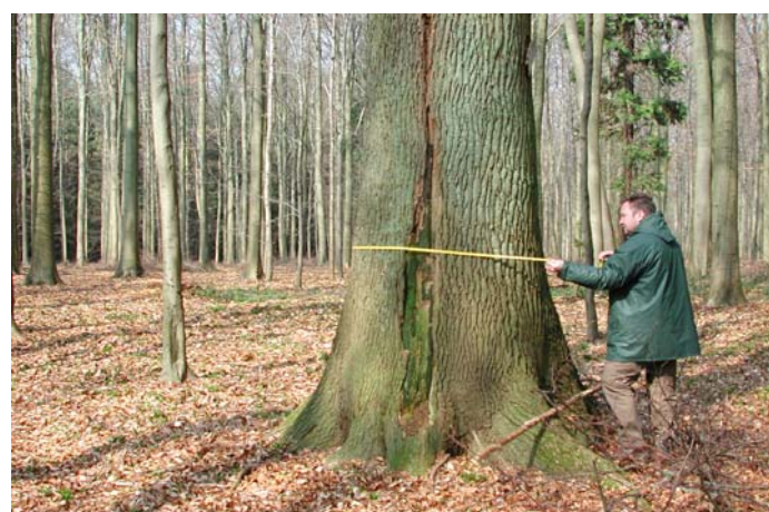
Eén van de weinige monumentale eiken (omtrek 390 cm) in Hallerbos die nog verwijzen naar het rijke middelhout-verleden.

Hans Baeté & Kris Vandekerkhove