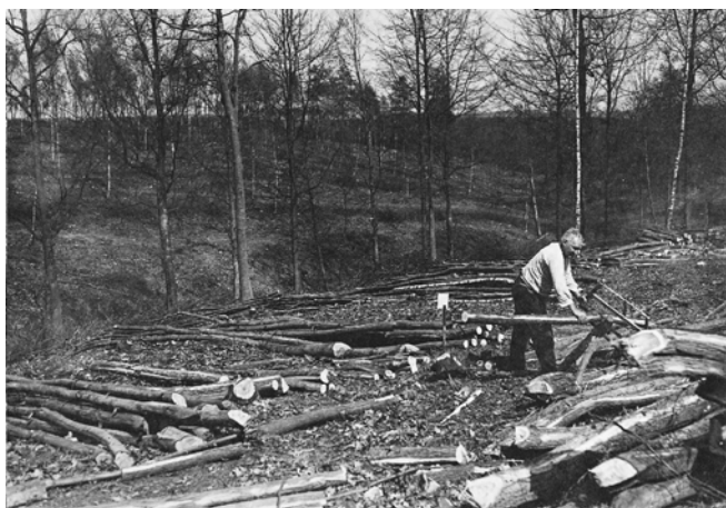
Exploitatie van hakhout in het 'kaalgeplukte' Hallerbos (ca 1940) – bemerk het hoge aandeel Robinia in het hakhout.

Een stuk uit 1735 illustreert dat het Hallerbos was opgesplitst in 14 houwen (met mooie namen zoals Cluyshaghe en Trois tillieux ), terwijl kapegegevens uit dezelfde periode consequent 13 houwen aanhalen. Aangezien elke houw hier was samengesteld uit in het zelfde jaar gekapte percelen, impliceerde dit een 13-jarige rotatiecyclus. Het verschil is te verklaren omdat twee kleinere of minder productieve houwen in de praktijk steeds werden samengenomen. Die omlooptijd van 13 jaar is echter tot dusver niet terug te vinden in publicaties over het Hallerbos... Veel meer kan je lezen in het genoemde basisrapport, dat deze zomer zal verschijnen.