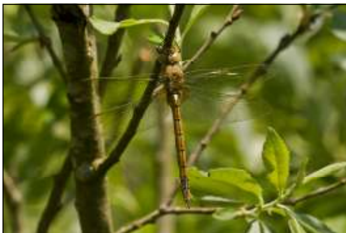
Foto 4: Pas uitgeslopen exemplaar van de Vroege glazenmaker ( Aeshna isoceles ).