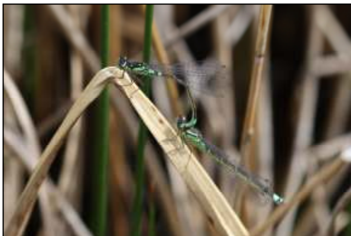
Foto 5: Tandem van de Donkere waterjuffer ( Coenagrion armatum ).