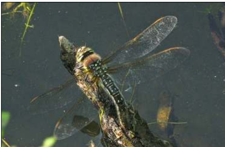
Foto 3: Eileggend vrouwkje Glassnijder in de Damvallei (foto: 1/05/2011, Ward Vercruysse)

De Damvallei is een laagveengebied met natte graslanden, ruigten en oude turfputten die voornamelijk als intensieve visvijvers gebruikt worden. Het gebied is verder bekend voor zijn stevige populatie Variabele waterjuffers Coenagrion pulchellum , Grote roodoogjuffers Erythromma najas , Smaragdlibellen Cordulia aenea en ook de - nog steeds zeer zeldzame - Vroege glazenmaker Aeshna isoceles vervolledigt het rijtje libellensoorten in dit door autosnelwegen doorkruiste laagveengebied. Het lijkt erop dat