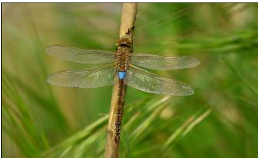
Foto 3: Zadellibel op migratie in Portugal begin april 2011.