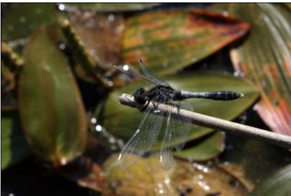
Foto 1: Sierlijke witsnuitlibel mannetje op 4 juni 2011 te Fouches.

De volgende dag, 22 mei 2011, werd de plaats door heel wat andere gealarmeerde libellenliefhebbers bezocht en leverde een telling niet minder dan 38 exemplaren op. Gezien het grote aantal dieren kan er van uitgegaan worden dat de soort op deze plaats al langer aanwezig is. De soort heeft in normale omstandigheden een tweejarige larva-