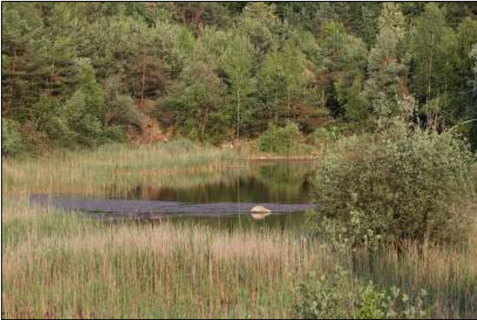
Foto 2: Zandgroeve in Fouches, waar deze Sierlijke witsnuitlibel gevonden werd.

le cyclus, een eenvoudig rekensommetje leert ons dus dat de soort wellicht in 2009 of vroeger op deze plaats aangekomen moet zijn.