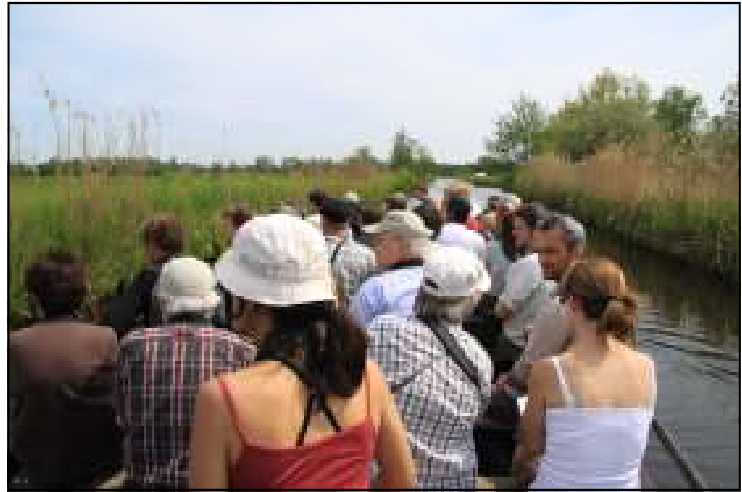
Foto 3: Met zo'n allen gezellig bootje varen naar de locatie van de Donkere waterjuffer

Snel werden de meegebrachte boterhammetjes verorberd waarna we ons verplaatsen naar de lokalen van Staatsbosbeheer in Kalenberg. Met bootjes en gids van Staatsbosbeheer vertrokken we even later naar een voor het publiek afgesloten deel van de Weerribben, meer specifiek naar één van de petgaten waar de Donkere waterjuffer of Coenagrion armatum aanwezig is. Deze soort werd pas een tiental jaar geleden terug in Nederland waargenomen na een afwezigheid van bijna 50 jaar. De Donkere waterjuffer komt verder nog voor in een beperkt aantal gebie-