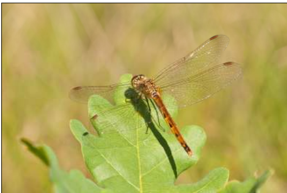
Foto 1. Kempense heidelibel in het Hageven.

De Kempense heidelibel heeft een heel specifieke levenscyclus die afwijkt van de meeste andere soorten. Zo brengt ze de winter door in het ei-stadium. Uit de eitjes kruipen in het voorjaar de larven die zich heel snel ontwikkelen en die in de loop van de zomer uitsluipen. Het uitsluipen van de eitjes valt samen met de voorjaarsregens, waardoor de plassen zich gedeeltelijk vullen met water. In het ondiepe water kan de