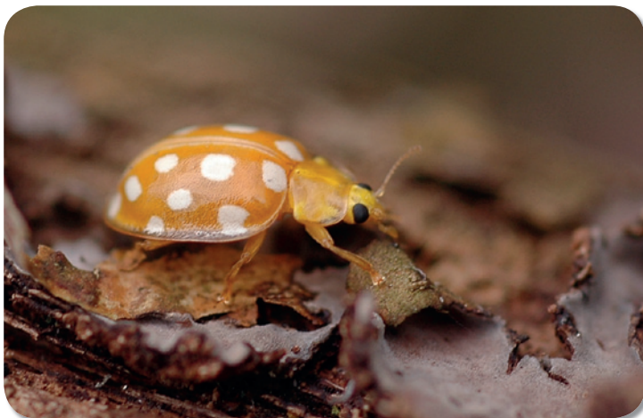
Het Meeldauwlieveheersbeestje, een schimmel-etende soort, is niet direct in competitie voor voedsel met het Veelkleurig Aziatisch lieveheersbeestje. Toch komt deze soort, die graag op esdoorn en eik zit, in dezelfde habitats voor en zijn haar eieren, larven en poppen dus gevoelig voor predatie door het Aziatisch lieveheersbeestje.