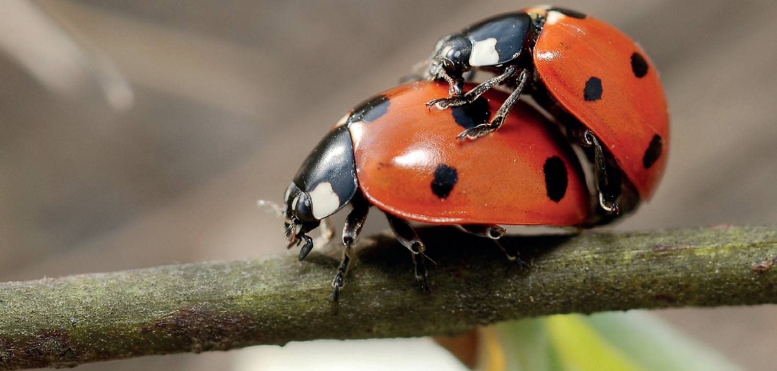
Het Zevenstippelig lieveheersbeestje overleeft in het labo de confrontatie met H. axyridis niet. In de natuur is het een van de weinige soorten die stabiel blijft, wellicht omdat ze groter is, meer op kruiden leeft en zich onmiddellijk laat vallen bij verstoring.

lieveheersbeestjes uitgevoerd (San Martin 2003, Ottart 2005). Met behulp van verschillende inventarisatietechnieken werd op lindes en platanen in parken, lanen (door het afkloppen van takken) en wegbermen (door middel van een sleepnet) het aantal individuen van de verschillende soorten lieveheersbeestjes geteld. Tussen april en oktober werden op elke plek telkens honderd takken van tien verschillende bomen bemonsterd. In tegenstelling tot bij de verspreidingsgegevens werd hier niet de kans op aan- of afwezigheid berekend, maar wel het aantal individuen per soort enerzijds en het aantal gevonden soorten in aan- of afwezigheid van het Veelkleurig Aziatisch lieveheersbeestje anderzijds (voor details van de statistische analyses verwijzen we opnieuw naar Roy et al. 2012).