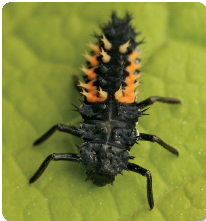
De larven van het Aziatisch lieveheersbeestje zijn met hun vraatzucht en superieure fysische en chemische verdediging succesvolle predatoren van lieveheersbeestjes en andere soorten insecten. Hun darm blijkt vol te zitten met chemische stoffen die enkel voorkomen in inheemse lieveheersbeestjes.

deze soort werd nog niet in het wild aangetroffen. Hoewel over deze theorie veel te vertellen valt (Davis 2009), is er gedeeltelijk bewijs dat ecosystemen met meer soorten, en dus meer ingevulde ecologische niches, minder gevoelig kunnen zijn voor biologische invasies (invasibility-diversity hypothesen, Knops et al. 1999). Theoretisch zou de invasie door het Veelkleurig Aziatisch lieveheersbeestje dus de drempel voor vestiging van andere exoten kunnen verlagen.