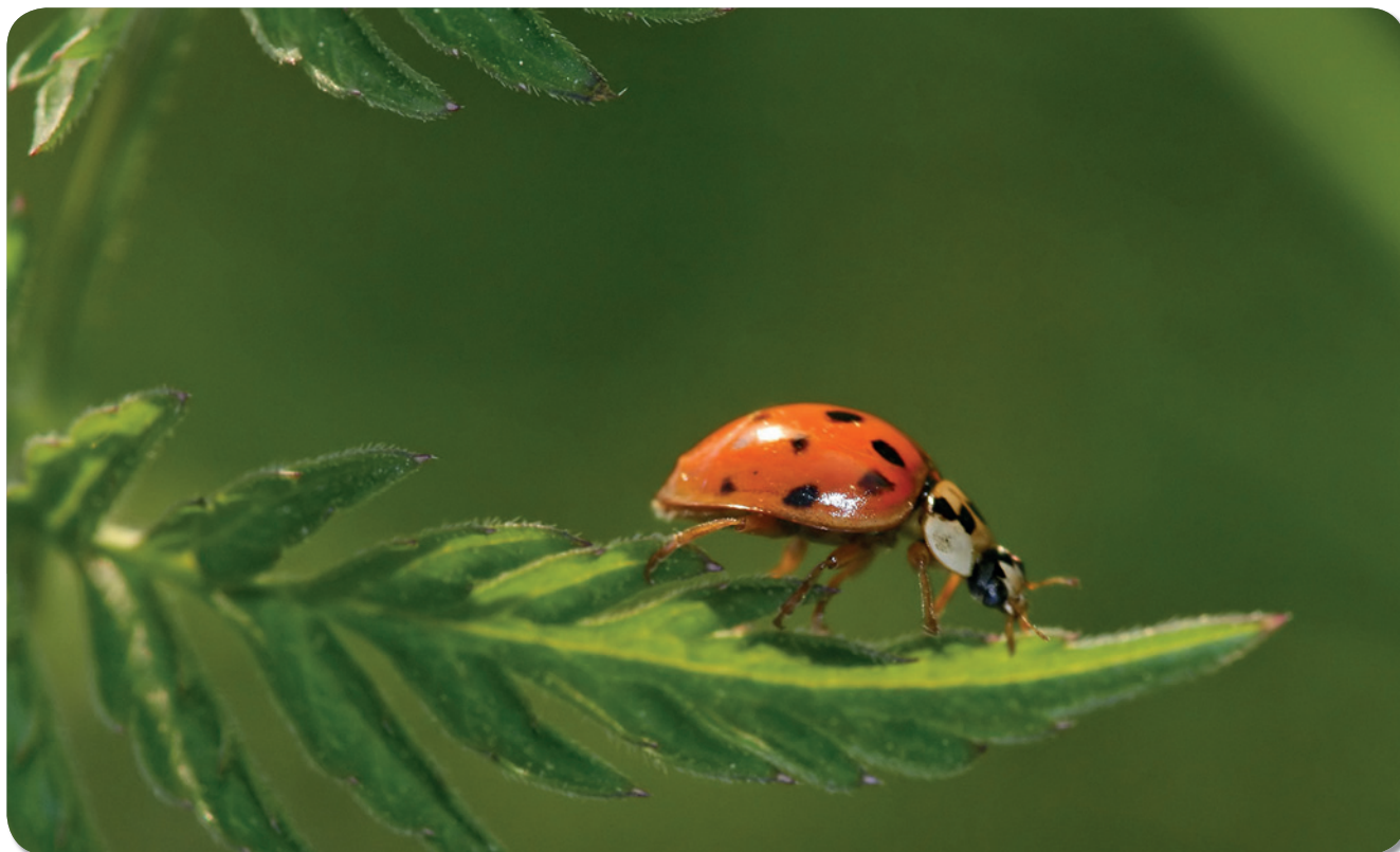
Het Veelkleurig Aziatisch lieveheersbeestje, nieuw voor de Belgische fauna en in enkele jaren tijd een van de algemeenste soorten lieveheersbeestjes geworden.

Zo'n tien jaar geleden maakten Adriaens & Gysels (2002) in Natuur.focus melding van de mogelijke impact van het Veelkleurig Aziatisch lieveheersbeestje op inheemse lieveheersbeestjes. Ze riepen toen ook op om alle waarnemingen te melden om zo een goed beeld te krijgen van de opmars van deze invasieve exoot. Door de vele waarnemingen, een gerichte monitoring en internationale samenwerking kunnen we nu duidelijk de negatieve gevolgen van de aanwezigheid van deze soort op sommige van de inheemse lieveheersbeestjes aantonen, en dit zowel in België als in enkele andere Europese landen.