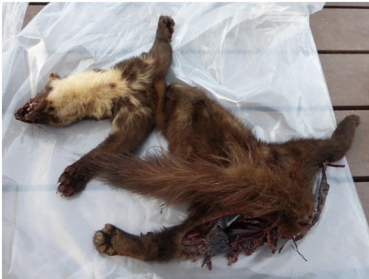
Boommarter ingezameld op 22 juni 2014 te Grobbendonk

Op minder dan 5 km ten noorden van de vindplaats van deze twee verkeersslachtoffers ligt de Lovenhoek, het natuurgebied waar een cameraval van JNM Neteland vorig jaar een jonge boommarter registreerde (zie marternieuws 11). Een kleine 10 kilometer ten zuidoosten ligt Wiekevorst, waar in het najaar van 2012 een boommarter werd betrapt in een kippenhok (zie Marternieuws 9). In 2002 werd een boommarter ingezameld in Herenthout, een buurgemeente van Grobbendonk.