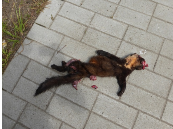
Boommarter ingezameld te Kapellen op 20 (links) en 28 (rechts) juni 2014