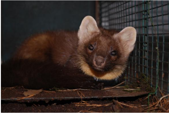
Madeleine met de grote oren, 8 november 2012

het deelgebied de Fondatie is een theoretische mogelijkheid, maar achten we weinig waarschijnlijk omdat er ook in dit gebied permanent fotovallen stonden. Indien Madeleine een tweedejaarsdier zou zijn, is er dus veel kans dat ze elders geboren werd. Indien ze zich in haar eerste levensjaar bevindt is het best mogelijk wel een dochter van Eufrasie. Dit jaar hebben we zekerheid over één jong, dat werd vastgelegd door de fotovallen en dat helaas op 6 juli als verkeersslachtoffer werd ingezameld (zie Marternieuws 8). We konden dit voorjaar Eufrasie niet telemetrisch volgen omdat de batterij van haar zender leeg was, de nestplaats was dan ook niet gekend en er werden geen observaties verricht; ook de fotovalopnames waren dit zomerseizoen schaarser dan in 2012. Hoewel we aanvankelijk dachten dat Eufrasie in 2012 slechts één jong had, moeten we ons toch de vraag stellen of Madeleine dan toch niet een tweede jong is, dat toevallig net niet samen met haar broer en moeder in beeld kwam bij de fotovalopnames.