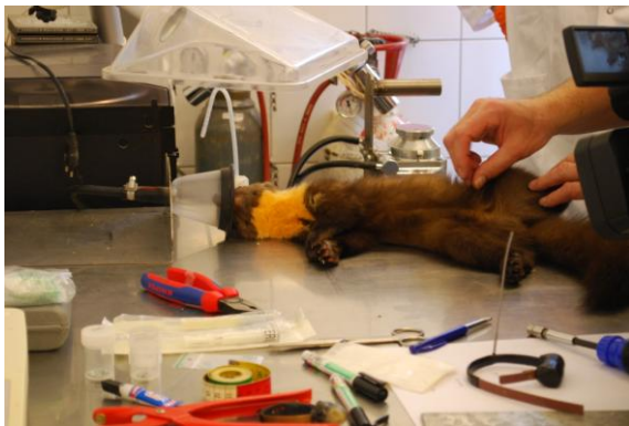
Het nemen van een haarstaal bij Germaine, 19 oktober 2012

Germaine is een dochter van Eufrasie en werd in het voorjaar van 2011 geboren in een spechtenholte in een Grauwe abeel, samen met haar broer Valère. Op basis van fotovalresultaten was al gebleken dat Germaine het voorbije jaar in de omgeving van de Vette-meers leefde (zie vorige edities Marternieuws). Op 19 oktober 2012 konden we haar vangen en voorzien van een halsbandzender. We hebben enkele filmpjes op ons Vimeo-kanaal gezet waarop ondermeer te zien is hoe Germaine de val markeert vóór ze gevangen werd en hoe ze reageert éénmaal ze gevangen zit .