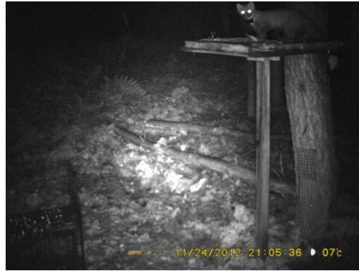
Madeleine na het zenderen op een voederplaats, 24 november 2012

Intussen hebben we DNA-stalen van zeven boommarters uit het onderzoeksgebied Sinaai : drie verkeersslachtoffers en vier gezenderde dieren. Via verwantschapsanalyse door onze genetica-collega's zullen we te weten komen of Madeleine al dan niet een dochter is van Eufrasie. Ook een inschatting van de mate van inteelt in deze kleine geïsoleerde (?) populatie, als zeer pertinente vraagstelling, behoort tot de mogelijkheden.