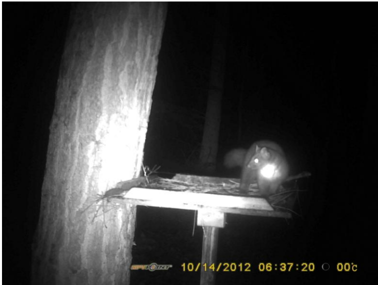
Eufrasie met haar nieuwe fluorescerende zender op de voedertafel, 4 oktober 2012

Madeleine gebruikt momenteel enkel de Fondatie. Dit deelgebied bestaat niet uit aaneengesloten bos maar uit een mozaïek van kleine bosjes, houtkanten, graslanden en enkele akkers. Het gebied de Fondatie wordt begrensd door de Stekense vaart, maar daar trekt ook Madeleine zich niks van aan: ze had haar dagrustplaats al minstens één maal in één van de bossnippers ten noorden van die vaart.