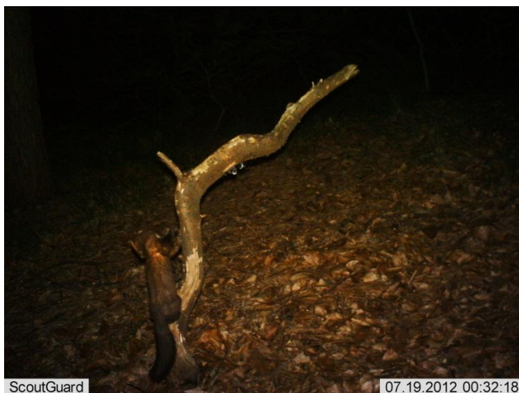
Boommarter in Meerdaalwoud, 19 juli 2012