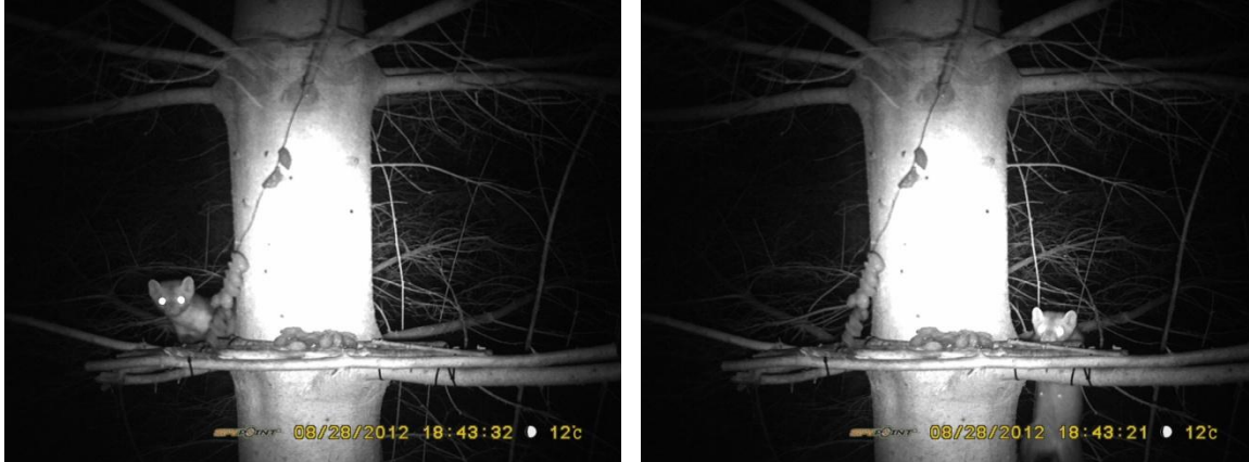
Boommarter in Doeveren, 28 augustus 2012

Dit nieuwe verkeersslachtoffer stimuleerde ons om toch nog maar eens een poging te wagen met de fotovallen in Doeveren (voor de derde keer al), onder het motto 'de aanhouder wint': misschien zijn er jongen. Na vele honderden foto's van bosmuizen stond op 28 augustus alvast één duidelijke boommarter op de gevoelige plaat. De plaats van opname en de plaats waar in juni een exemplaar sneuvelde, liggen op korte afstand van elkaar, maar wel gescheiden door de autosnelweg E403!