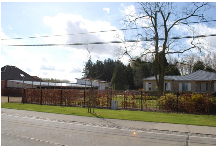
Dagrustplaats van Valère in Wachtebeke op 20 april 2012: een mooi voorbeeld van hoe een boommarter eender waar kan opduiken

Ook na deze eerste uitstap viel het op hoe onrustig Valère zich gedroeg. Het duurde dan ook niet lang voor hij opnieuw vertrok, ditmaal in de andere richting. Op 26 april, de tweede zoekdag na zijn tweede 'verdwijning' vonden we hem terug in de omgeving van Stekene, in een populierenbos met een onderetage van fijnspar ten noorden van de Stekense vaart. Deze locatie bevindt zich op 'slechts' 2.6 km in vogelvlucht van zijn voormalig leefgebied. Vermoedelijk was hij opnieuw op de terugweg en zat hij de dag voordien veel verder, vermits we toen op dezelfde locatie geen signaal hadden. Op 27 april vonden we hem effectief in de Fondatie, in een klein sparrenbosje tegen de zuidzijde van de Stekense vaart. De twee daaropvolgende weken zat hij afwisselend in de Vette-meers en de Heirnisse. Op 15 mei hebben we onze voorlopig laatste peiling van Valère kunnen realiseren. Toen was hij bijzonder actief aan het rondlopen in de Fondatie. De dag nadien was hij voor de derde keer verdwenen. De daaropvolgende week hebben we zonder succes een gebied afgezocht begrensd door de Gentse Kanaalzone, de E17, de expresweg Knokke-Antwerpen/Nederlandse grens en de polders rond het Antwerpse havengebied. Met een zenderbereik van 2 km en 'dankzij' het dichte Vlaamse wegennet, ook in en rond bosgebieden, zou het in theorie mogelijk moeten zijn om de boommarter terug te vinden als hij ergens binnen deze regio in een bosgebied zit. In de praktijk zijn er natuurlijk complicaties, afhankelijk van het terrein