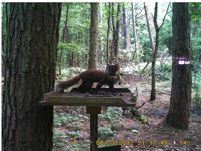
Eufrasie op de voedertafel in de Heirnisse, 23 juni 2012