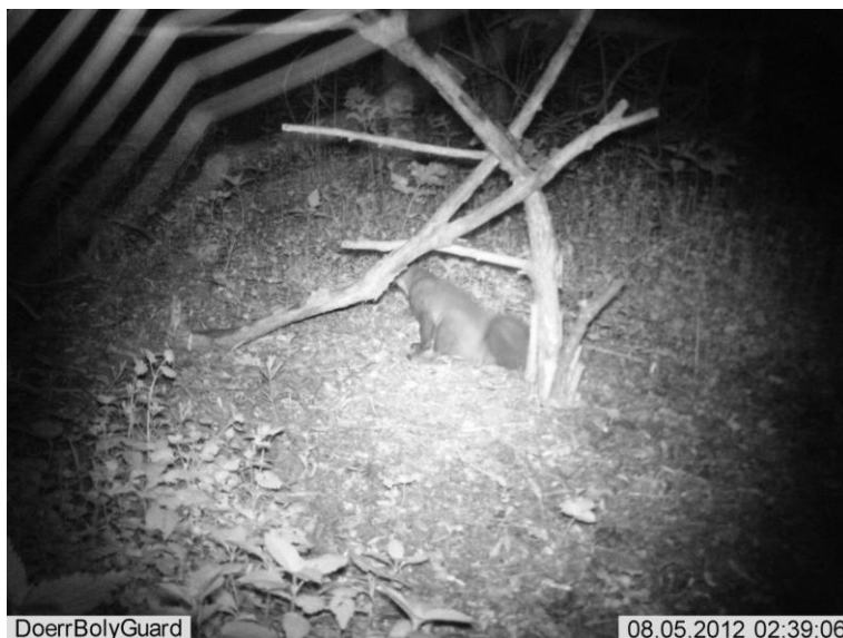
Ongezenderd mannetje nabij de Vette-meers, 08 mei 2012

Ondertussen had Geert Braem opnieuw een fotoval geïnstalleerd in een reservaatperceel aan de buitenrand van de Vette-meers. Deze locatie had al enkele keren foto's opgeleverd van een ongezenderde marter. Telkens ging het om een fors exemplaar (waarschijnlijk een mannetje). Op 08 mei jongstleden staat opnieuw een zeer forse boommarter op de foto's, een overduidelijk mannetje (bemerkt de dikke hals, typisch voor mannelijke marters).