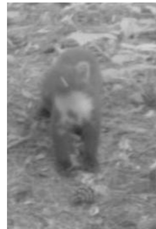
Eufrasie en haar jong in de Heirnisse, 24 juni 2012 (foto INBO, links ) en detail van de keelvlak van het jong van Eufrasie, 23 juni 2012 (foto INBO, rechts)