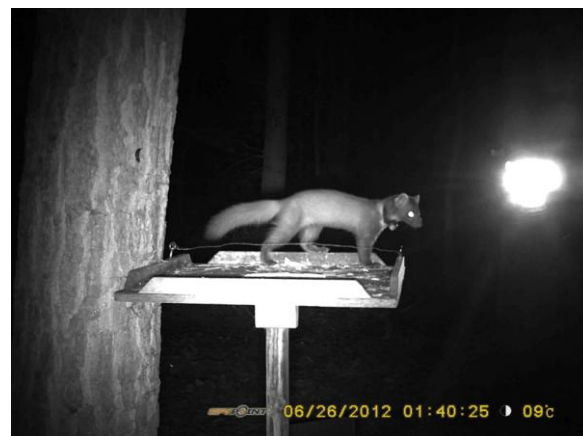
Eufrasie op de voedertafel in de Heirnisse, 22 en 26 juni 2012