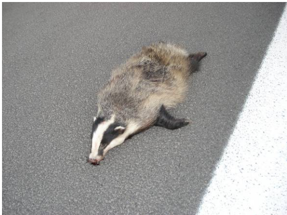
Das ingezameld te Bierbeek op 8 mei 2011, (foto Stephan Bruyinckx)

Het was een volledig intact mannetje, de schedel, ribbenkast en beide voorpoten waren gebroken door de impact van de aanrijding. Te beoordelen aan de tandslijtage was het een meerjarig mannetje (2 tot 4 jaar oud). De stuit en de hals vertoonden geen enkel spoor van sociale interactie (bijtwonden). Het dier had weinig of geen vetreserves (onderhuids vet, mesenteraal vet en niervet) en een lege maag. Mogelijk was dit een solitair mannetje dat reeds geruime tijd aan het rondzwerven was.