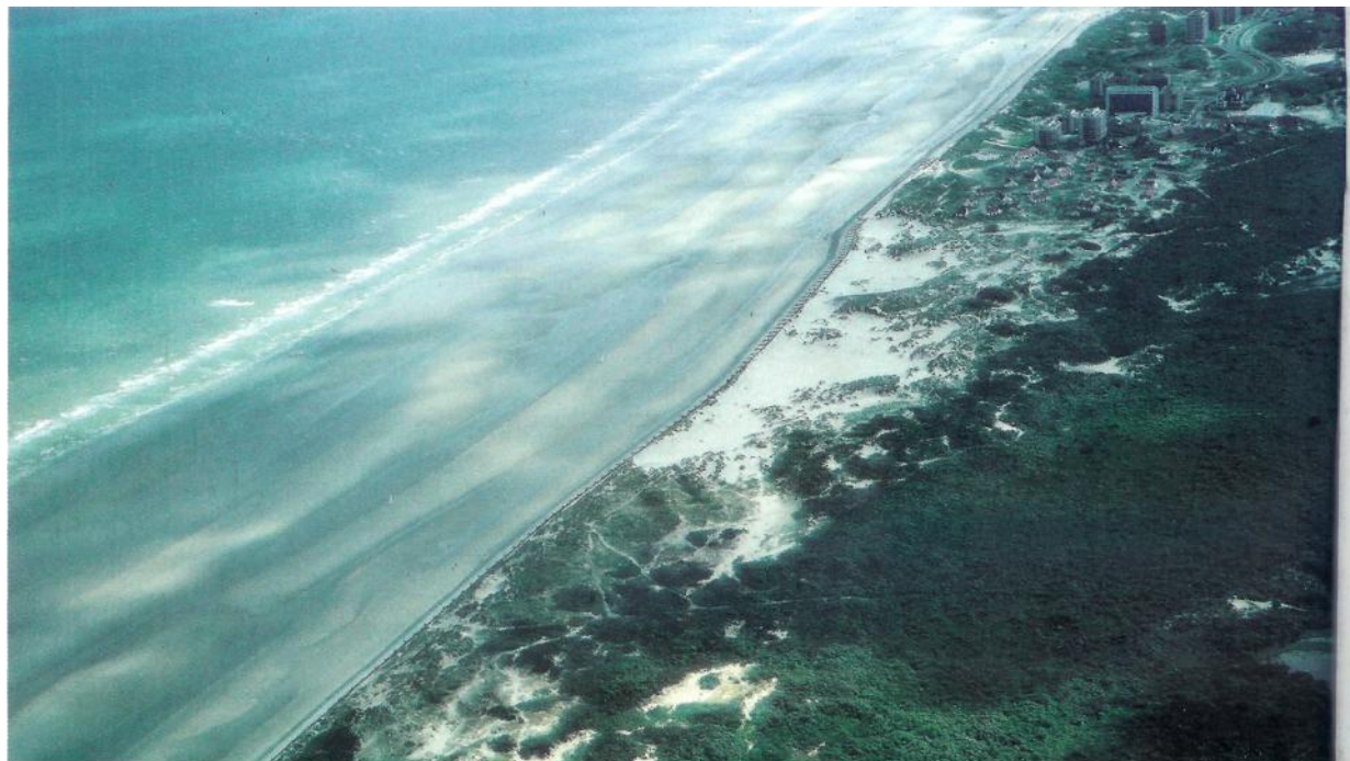
Foto 1. Luchtfoto Belgische kust ter hoogte van De Panne. De bevoegdheidsverdeling voor het beheer van de Belgische kustzone is erg complex. Als gevolg van de Belgische staatsstructuur kan de federale overheid bepaalde activiteiten niet beperken in de mariene Speciale Beschermingszones.

In 2003 werd door de toenmalige Minister van de Noordzee een nieuwe poging ondernomen voor de afbakening van mariene beschermde gebieden. Deze keer werd voorzien in grondige bilaterale overleg rondes met de diverse stakeholders en lokale overheden. Op basis van wetenschappelijke gegevens werden voorstellen tot afbakening van Speciale Beschermingszones voorgelegd. Deze voorstellen bevatten tezelfder tijd ook voorstellen voor mogelijke beheermaatregelen. Op grond van deze consultatierondes werden de beheermaatregelen aangepast. Bovendien werd in een nieuw instrument voorzien van vrijwillige gebruikersovereenkomsten. De afbakening van de