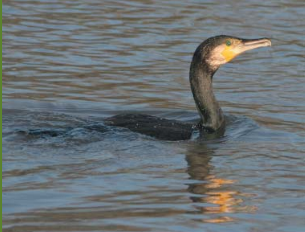
Aalscholver - Koen Devos

Al vele jaren wordt de aantalsontwikkeling van Aalscholvers in Vlaanderen door het INBO op de voet gevolgd, zowel in het broedseizoen als in de winterperiode. Dankzij de medewerking van een groot aantal vrijwilligers en Natuur.Studie zijn de telresultaten voor de periode 2006-2007 nagenoeg 100 % volledig.