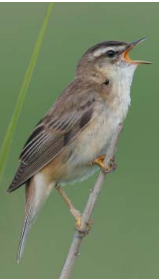
Rietzanger - Koen Devos

gebieden aanmaken kan je doen door links in het hoofdmenu te klikken op 'Invoeren' onder 'Gebieden'.