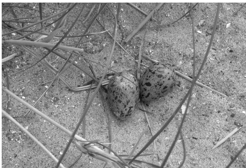
Figuur 3. Eieren van het paartje Dougalls Stern x hybride Dougalls Stern * Visdief – Eggs of the mixed breeding pair Roseate Tern x Roseate Tern * Common Tern.

droeg de vogel een BTO-ring (SR14895), rechts een metaalring met de code 95S8. De vogel werd op 22 juli 2004 als pullus geringd in de kolonie van Lady's Island Lake in Wexford (Ierland). Dit was de eerste terugmelding van dit individu.