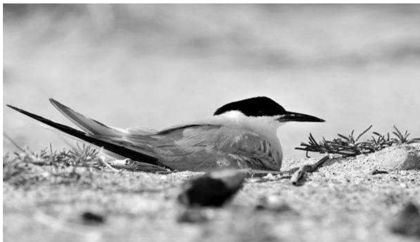
Figuur 6. Hybride-ouder Dougalls Stern * Visdief. Let op de lange, volledig witte start, de brede witte randen aan de binnenste handpennen en de donkere snavel – Hybrid-parent Roseate Tern X Common Tern. Note the long, completely white tail, the broad white edges to the inner primaries and the dark bill.