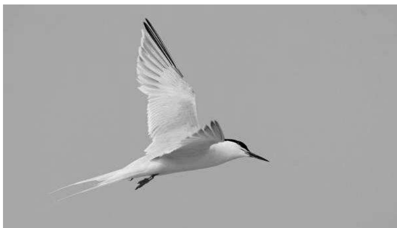
Figuur 5. Dougalls-ouder van het paartje Dougalls Stern x hybride Dougalls Stern * Visdief – Roseate-parent of the pair Roseate Tern x Roseate Tern * Common Tern.

Gemengde broedgevallen van zuivere Dougalls Sterns met zuivere Visdiefjes werden al vrij vaak vastgesteld. In het Zwin bij Knokke (België) was er van 1976 tot en met 1987 jaarlijks een gemengd paar aanwezig dat in zeven jaren ook daadwerkelijk tot broeden kwam (De Ruwe & De Smet 1997). In 1979 waren er zelfs twee gemengde broedgevallen in het Zwin. Gemengde broedgevallen met Visdief werden verder onder meer vastgesteld in Nederland (Beijersbergen 1988), Groot-Brittannië (Robbins 1974) en in het noordoosten van de Verenigde Staten (Zingo et al. 1994). Een gemengd broedgeval met Noordse Stern werd beschreven in Nova Scotia (Canada; Whittam 1998) en Schotland (Ewins 1987). In nagenoeg alle gevallen waar het geslacht bekend was, waren de Dougalls Sterns net zoals in Zeebrugge wijfjes (Whittam 1998).