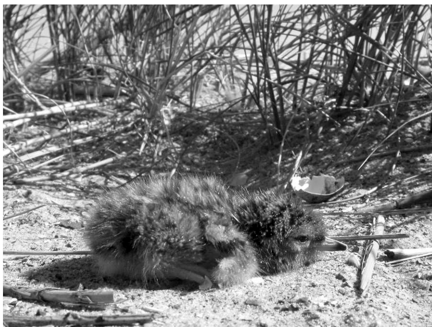
Figuur 4. Jong van het paartje Dougalls Stern x hybride Dougalls Stern * Visdief – Chick of the breeding pair Roseate Tern x Roseate Tern * Common Tern (W. Courtens).

tussen Visdieven in tegenstelling tot de rauwe roep van de Dougalls Stern. Het is niet duidelijk of deze vogel een F1-hybride (eerste-generatie hybride) dan wel een F2-hybride (tweede-generatiehybride) of een terugkruising was.