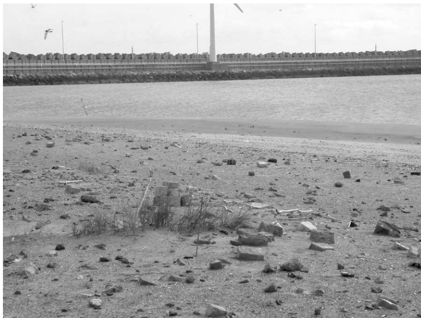
Figuur 2. Nestplaats van het paartje Dougalls Stern x hybride Dougalls Stern * Visdief – Nestsite of the mixed breeding pair Roseate Tern x Roseate Tern * Common Tern (W. Courtens).

45.5 x 29.8 mm, breedste ei 42.5 x 32.1 mm; n = 122). De maten van het eerste ei waren dus identiek aan die van het langste visdiefei in 2008. Eieren van Dougalls Stern in Rockabill (Ierland) waren in de periode 2002-2004 gemiddeld 43.5-44.2 mm lang en 29.6-30.2 mm breed (Ratcliffe et al. 2004).