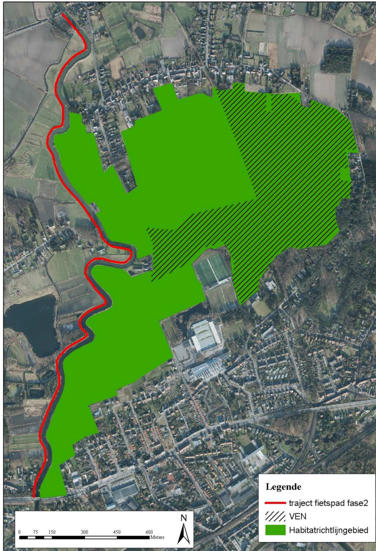
Figuur 3. Ligging Habitatrichtlijngebied