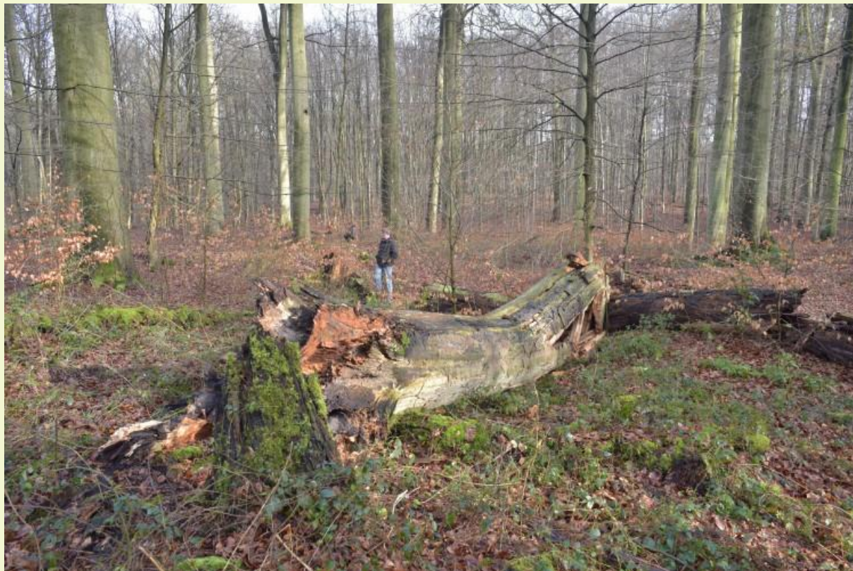
Figuur 5: In structuurrijke, natuurlijk ontwikkelende beukenbossen hebben monumentale oude bomen, zwaar dood hout en kleine openingen in het kronendak een grote betekenis voor de biodiversiteit (Joseph Zwaenepoel bosreservaat, Zoniënwoud)

Onderzoek op doodhoutkevers (Müller et al., 2012) toonde aan dat ruim 70% van alle gekende saproxyle keversoorten in Europa reeds in door beuken gedomineerde bossen is aangetroffen. Verder blijkt dat vooral oude beukenbestanden en –bomen zeer soortenrijk zijn. Heel wat zeldzame en veeleisende soorten kevers, mossen, korstmossen en zwammen komen hoofdzakelijk of uitsluitend op deze oude bomen voor (Fig. 5).