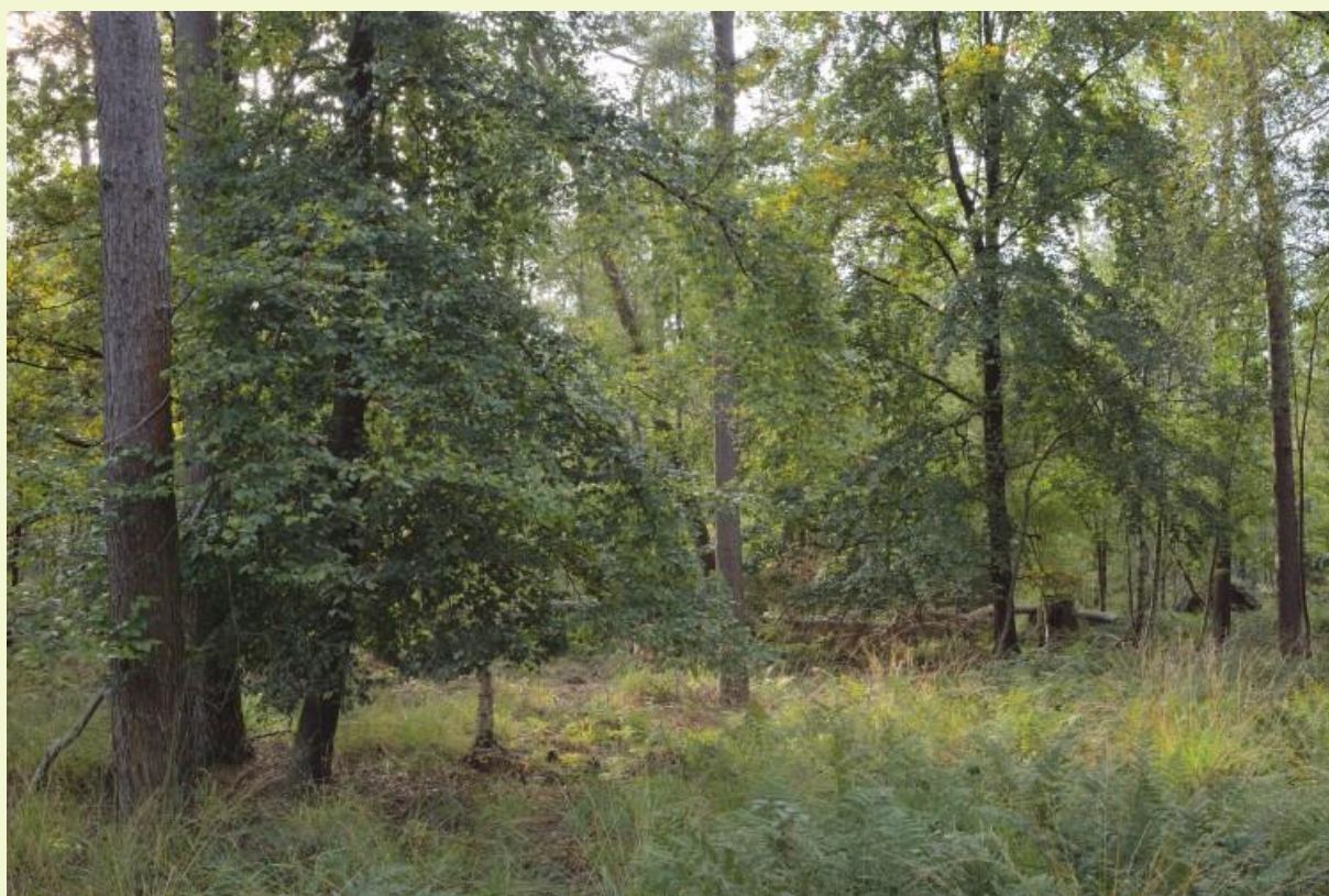
Figuur 4: Jonge beuken die zich spontaan hebben gevestigd in een naaldhoutbestand op zandgrond, hebben de voorbije droogte en hitte goed doorstaan en groeien door naar de nevenetage (Drongengoed, oktober 2020).

In vele Vlaamse bossen, zowel op zand- als op leemgronden, zien we regelmatig jonge, natuurlijk gevestigde beuken die ook verder doorgroeien (Fig. 4). In ons grootste beukenbos, het Zoniënwoud, zien we sinds enkele decennia veel meer gevestigde en doorgroeiende verjonging van beuken dan voorheen, zonder duidelijk aanwijsbare reden (Everts et al., 2020). Deze succesvolle verjonging en het feit dat de jonge beuken weinig hinder schijnen te ondervinden van de droge periodes van de afgelopen jaren, kunnen er op wijzen dat de actuele omstandigheden in vele van onze bossen nog steeds geschikt zijn voor beuk.