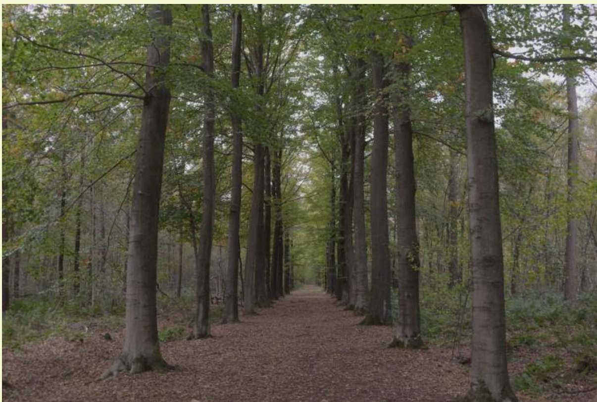
Figuur 3: Terwijl beuken in het open landschap er vaak slecht aan toe zijn na drie droge en hete zomers (foto boven), houden beuken in gesloten bossen goed stand (foto onder). Beide foto's zijn op enkele 100den meter afstand van elkaar genomen (Kruiskerke, Ruiselede; Foto's: Kris Vandekerkhove, oktober 2020)