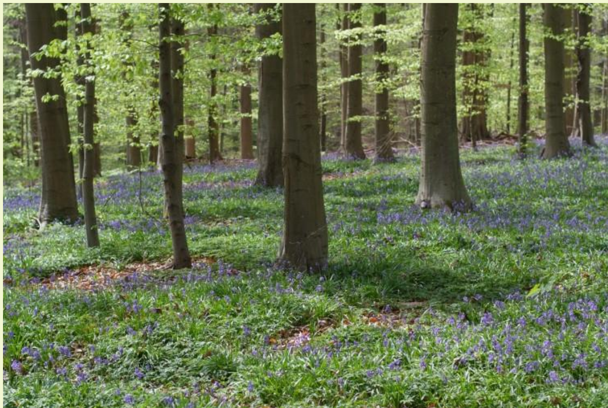
Figuur 6: Door de sterke schaduwdruk in gesloten beukenbossen kunnen voorjaarsbloeiërs zoals wilde hyacint er tot dominantie komen (Harras, Zoniënwoud; foto Luc De Keersmaeker)

vaatplanten die wijzen op verstoring hoeft dus niet noodzakelijk problematisch te zijn (Boch et al., 2013). Schaduwtolerante oudbosplanten, zoals bosanemoon en wilde hyacint, zijn wel goede kwaliteitsindicatoren en kunnen in gesloten beukenbossen met een hoge schaduwdruk aanzienlijk toenemen (Van Calster et al., 2007). Een tapijt van wilde hyacint, zoals in het Hallerbos, is in belangrijke mate toe te schrijven aan het dichte en gelijkjarige scherm van vitale beuken, dat weinig licht doorlaat (Fig. 6).