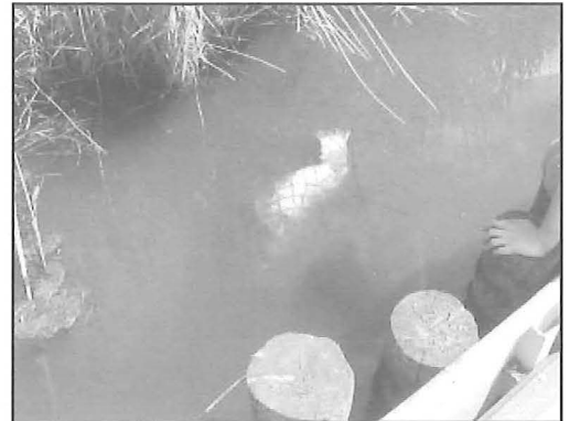
Foto 9: een dode vis zit vast in het lege omhulsel van de kokosrol

Informatie over andere faunagroepen (aquatische ongewervelden, vissen) gerelateerd aan de oevertypes ontbreekt vooralsnog. Dit gebeurt in een volgende fase van het onderzoek en zal een meer globale ecologische evaluatie mogelijk maken. Ook de monitoring van vegetatie en broedvogels zal nog een aantal jaren worden verder gezet, om eventuele trends op te volgen.