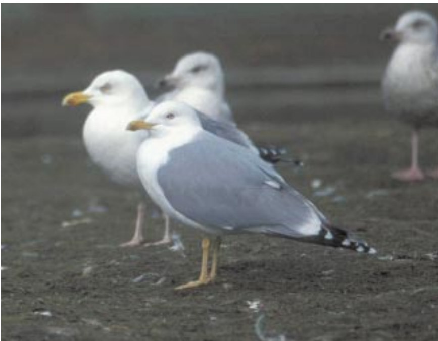
Foto 11. argenteus -Zilvermeeuw adult, 28 januari 2001 te Knokke. De knalgele poten maakten deze vogel verdacht. Grootte, structuur, vleugelpatroon en lichte mantel toonden aan dat het om een gewone Zilvermeeuw ging. De spierwitte kop viel op tussen de andere meeuwen maar is zeker niet uitzonderlijk voor Zilvermeeuwen eind januari.

Bij de herkenning zal vooral het verschil tussen cachinnans (Pontische Meeuw) en michahellis (Geelpootmeeuw) worden benadrukt. De verschilpunten met argentatus (Zilvermeeuw) zullen echter ook duidelijk blijken uit de tekst. Bij de Geelpootmeeuw worden ook de verschilpunten met Kleine Mantelmeeuw toegelicht.