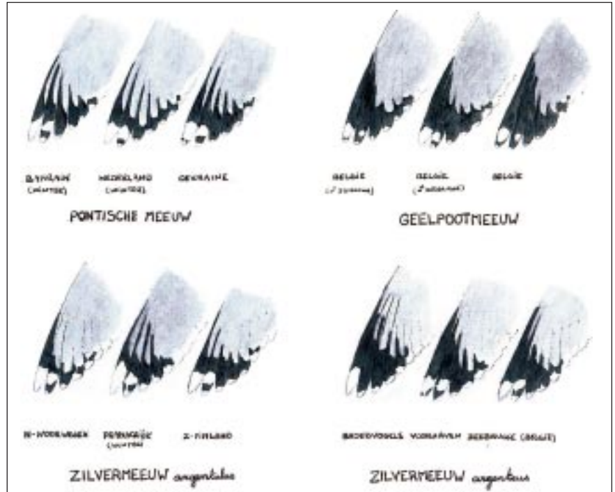
Figuur 1: Handpenpatronen van adulte meeuwen. Tenzij anders vermeld gaat het om vogels uit het broedgebied. Bemerkt dat met drie voorbeelden van elk taxon onmogelijk de variatie binnen dit taxon kan worden weergegeven. De figuur geeft echter wel een zeer goed beeld van wat men mag verwachten. (Figuur: Geert Spanoghe)