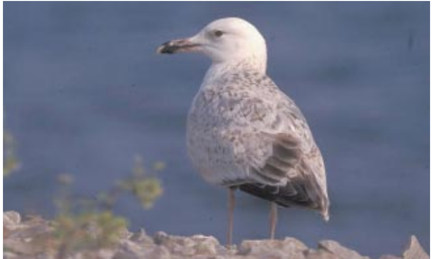
Foto 20. Pontische Meeuw Larus cachinnans 1e zomer, 1 mei 1999 te Kluizen. Bemerkt de typische tekening op tertials en grote dekveren, lange snavel, al spierwitte kop (met nekband) en onderdelen. Het patroon van de 2de generatie schouderveren met één smal ankertje wijst ook op Pontische Meeuw.