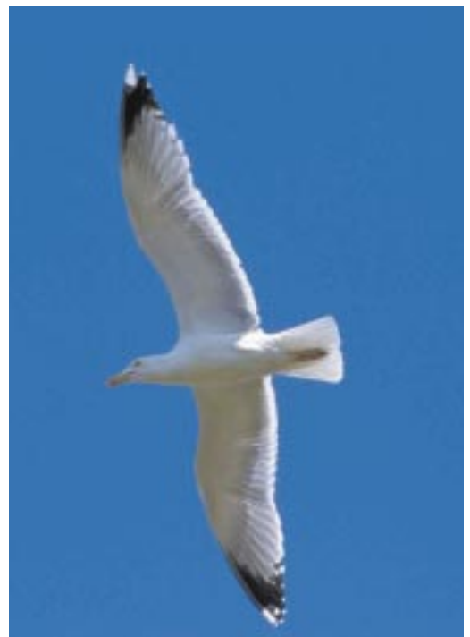
Foto 8. Geelpootmeeuw Larus michahellis adult mantetje, 15 juni 2002 in voorhaven Zeebrugge (vormt koppel met vijfje Kleine Mantelmeeuw). Zwart op 6 handpennen (bandje op P5) en afwezigheid van lichte tongen geven een grote zwarte vleugeltip. Bemerkt de zeer kleine spiegel op P9.

In tegenstelling tot de Geelpootmeeuw blijft de Pontische Meeuw veel meer overwinteren in Noordwest-Europa. In de periode december '97 tot januari '98 werden in oostelijk Duitsland meer dan 2000 Pontische meeuwen geteld. Iets noordelij-