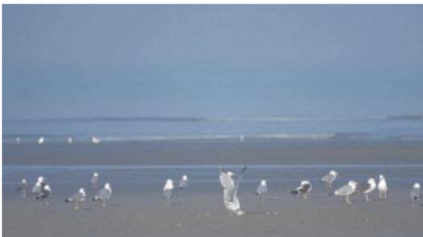
Foto 1. Geelpootmeeuwen Larus michahellis , Grote Mantelmeeuw Larus marinus en Kleine Mantelmeeuwen Larus fuscus , 25 augustus 2002 te De Panne. Gemengde groepjes van rustende vogels bevatten soms tientallen Geelpootmeeuwen (14 ex. op deze foto).

In de steppegebieden van Centraal-Azië komt nog barabensis voor, een meeuw die meestal duidelijk herkenbaar is van cachinnans (althans de adulten) en typisch broedt in rietmoerassen van steppemeren. Deze wordt niet ondergebracht in cachinnans . Verder onderzoek zal moeten aantonen waar dit taxon thuishoort. Jonsson stelt voor om de naam Steppemeeuw voor te behouden voor het geval barabensis in de toekomst de soortstatus zou verwerven of indien cachinnans en barabensis als één soort zouden beschouwd worden. De huidige Duitse naam, Steppemöwe, voor cachinnans (exclusief barabensis ) vindt hij daarom niet opportuun (Jonsson, 1998). Barabameeuw (naar de gelijknamige Baraba-steppe) is misschien een duidelijke-