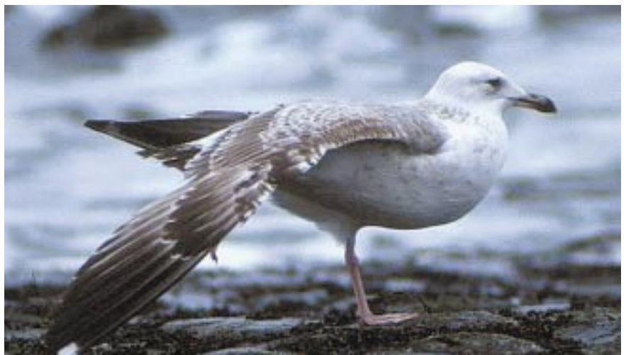
Foto 21. Pontische Meeuw Larus cachinnans 2de winter, 11 november 2000 te Westkapelle (NL). De witte spiegel op P10 in het tweedewinterkleed (tweede generatie handpennen) komt zeer vaak voor bij deze soort, in tegenstelling tot Geelpoot- en Zilvermeeuw.