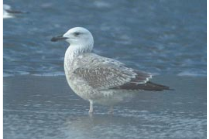
Foto 19. Pontische Meeuw Larus cachinnans 1ste winter, 20 november 2000 te Nieuwpoort. Kopvorm, al lichte kop met donkere nekband en al zeer lichte onderdelen, al vrij ver uitgekleurde parallelle snavel, Stormmeeuw-achtige tertials en lichte toppen op grote en middelste dekveren passen alleen voor Pontische Meeuw.

De staartband is ook zichtbaar breder dan bij Geelpootmeeuw.