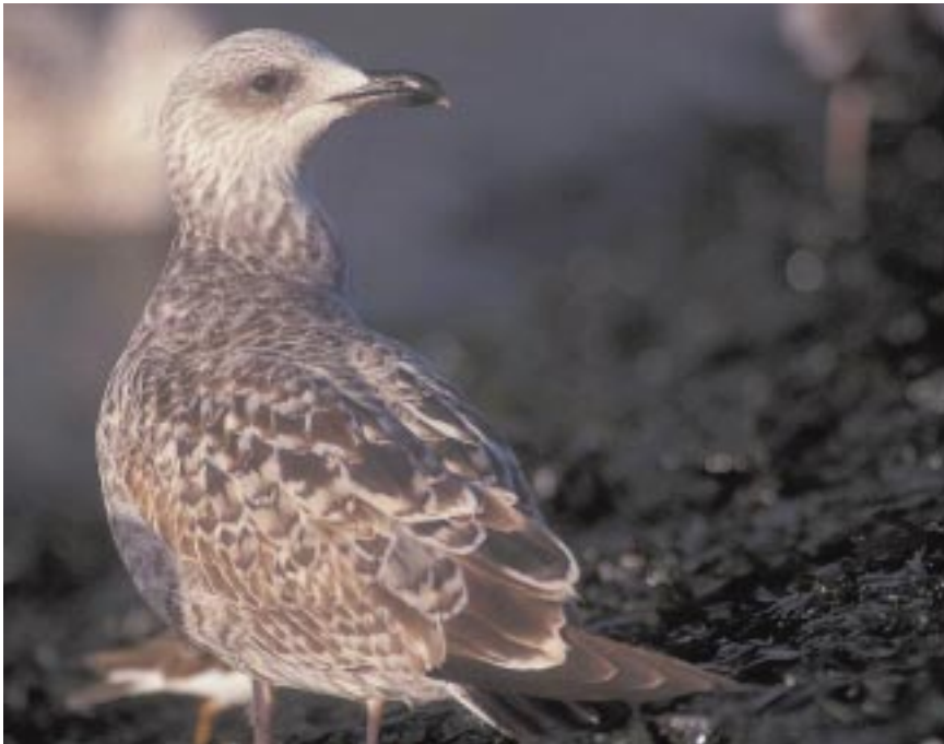
Foto 13. Geelpootmeeuw Larus michahellis juveniel/1ste winter, oktober 1999 te Nieuwpoort. Vooral de nieuwe schouder- en mantelveren, vrij veel nieuwe vleugeldekveren en bovenste tertial op deze datum wijzen op Geelpootmeeuw. Dit was een vrij donkere vogel. Staartband, vleugelvenster en halve donkere baan op grote dekveren waren meer typische Geelpoot-kenmerken.