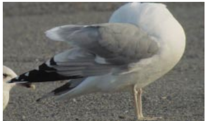
Foto's 3 en 4. Pontische Meeuw Larus cachinnans adult, 5 januari 2002, Le Portel (Fr). Lange parallelle snavel zonder duidelijke gonyshoek, klein, donkerder oog en fletsgekleurde poten zijn typische kenmerken. De lichte tongen op de binnenvlag van de buitenste handpennen zijn net zichtbaar. Een breed bandje op P5 (net onder de opgeheven tertials) is een kenmerk voor zowel Geelpoot- als Pontische Meeuw.