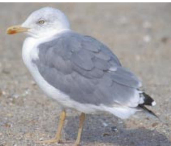
Foto 9. Geelpootmeeuw Larus michahellis adult, 5 september 2002 te Mariakerke. Korte snavel met duidelijke gonyshoek, felgele poten en snavel, donkergrijze mantel en typische kopstreping geconcentreerd rond het oog. Vogel in actieve handpenruï.

We weten echter zeker dat in de Belgische Maasvallei tientallen exemplaren overwinteren, in de rest van het land worden zelden meer dan twee exemplaren bijeen gezien. Bij tellingen aan de Vlaamse stranden blijken tegelijkertijd nooit meer dan vijf vogels aanwezig te zijn.