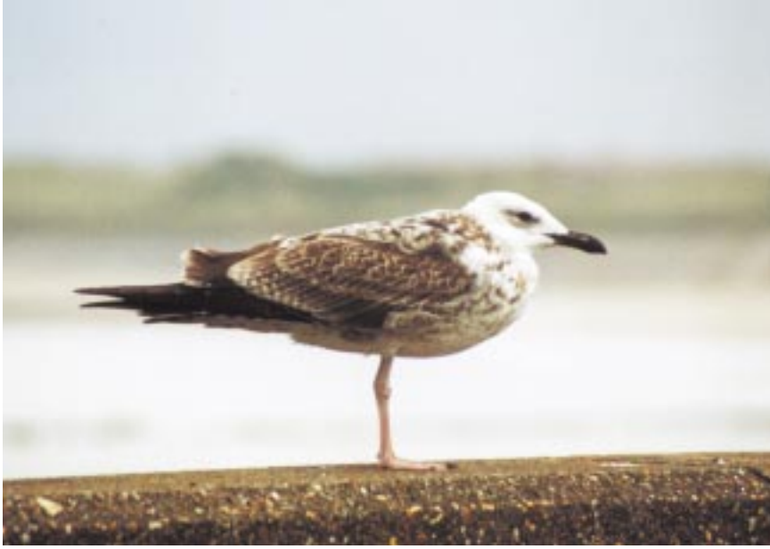
Foto 12. Pontische Meeuw Larus cachinnans juveniel, 21 september 2001 te Oostende. Kop- en snavelvorm, al zeer witte onderdelen, lichte toppen aan grote en middelste dekveren, donkere tertials en lange, smalle poten wijzen allemaal op deze soort.