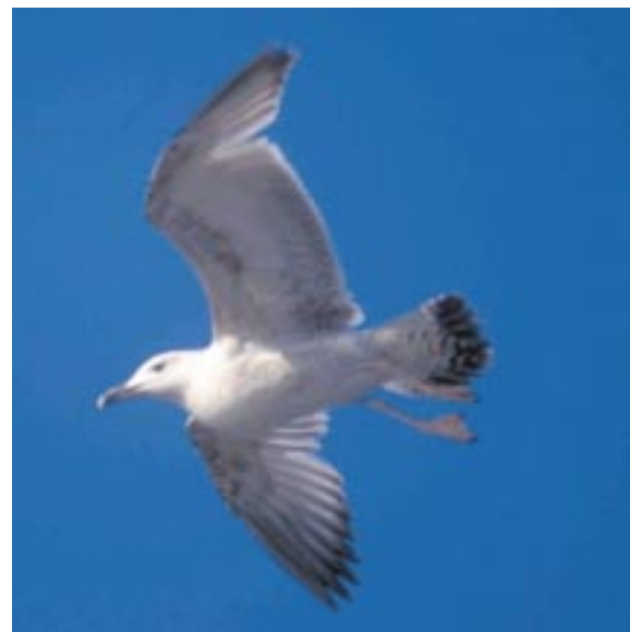
Foto 15. Pontische Meeuw Larus cachinnans 1ste zomer, 30 april 1999 te Gent. Lichte ondervleugel met bijna witte oksels en middelste dekveren zijn een belangrijk verschil met Geelpootmeeuw. Bemerkt ook de vrij brede contrasterende staartband.