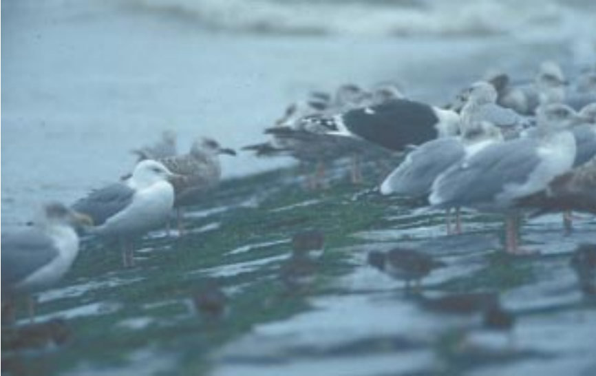
Foto 2. Pontische Meeuw Larus cachinnans adult, 20 november 2000 te Middelkerke. Een adulte vogel valt in het najaar op tussen de Zilvermeeuwen door de witte kop, donker oog, fletsgekleurde snavel en poten en een andere structuur.

re naam voor barabensis . Voorlopig blijven we echter de naam Pontische Meeuw gebruiken voor cachinnans !