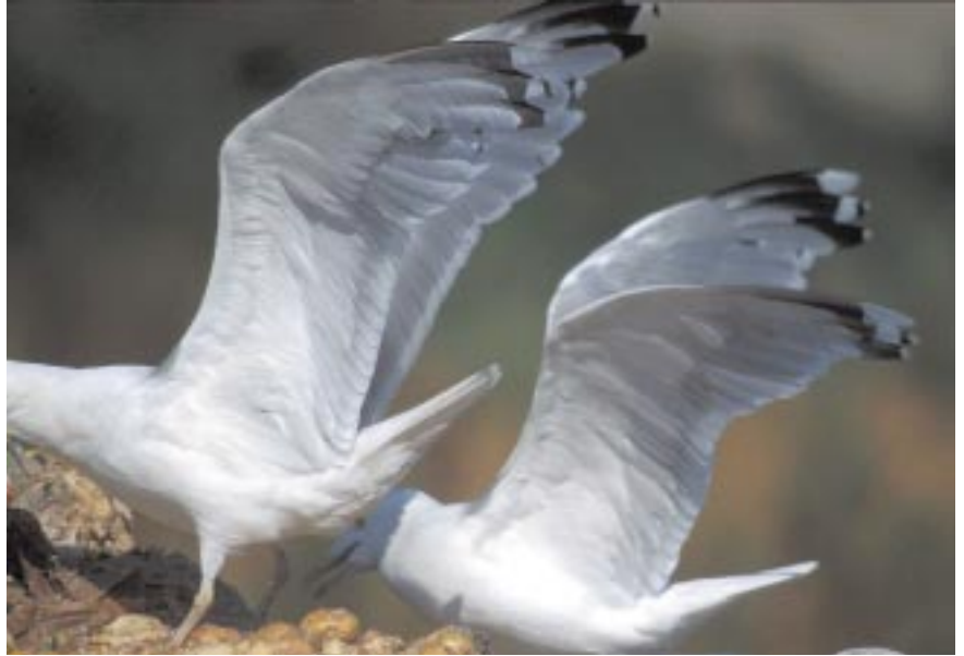
Foto 10. Baltische Zilvermeeuwen Larus argentatus adult, 10 augustus 2002, Tampere (Fl). Pas op: de vogels zijn in de rui: P8-10 oud, P6-7 ontbrekend, P1-5 nieuw. De voorste vogel heeft een bandje op P5 en geelachtige poten, de achterste geen bandje op P5 en had felgele poten. De witte tongen op de buitenste handpennen zijn typisch voor zowel cachinnans als Zilvermeeuwen uit Scandinavië.

De in dit artikel behandelde 'zeldzamere soorten' komen bij ons regelmatig voor en zijn bovendien duidelijk te herkennen zodat het een uitdaging moet zijn voor elke vogel-