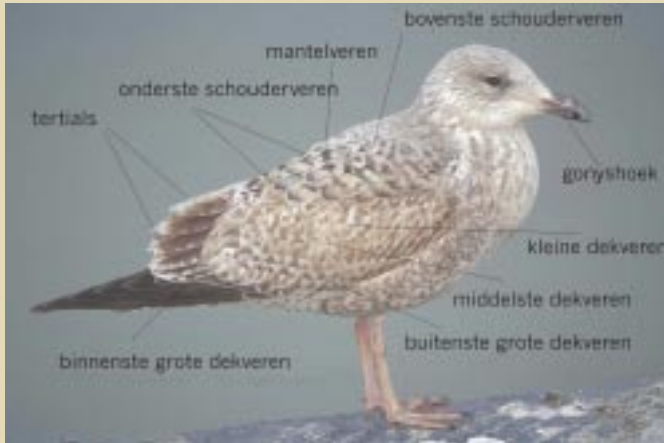
Foto 6. (R) Zilvermeeuwen Larus argentatus 1ste winter, maart 1999 te Nieuwpoort. Licht venster en lichte, gebandeerde grote dekenveren zijn typisch voor Zilvermeeuw. Zowel boven- als onderstaart zijn nog volledig getekend met brede, onopvallende staartband (Foto: Geert Spanoghe)

Foto 5. (L) Zilvermeeuw Larus argentatus 1ste winter, maart 1999 te Nieuwpoort. Bemerkt het contrast tussen de volledig nieuwe (2de generatie) mantel en schouderveren en de juveniele (1ste generatie) vleugeldekenveren en tertials. De nieuwe schouderveren hebben het typische 'dubbel anker'-patroon echter minder contrasterend dan Geelpootmeeuw. Nog zeer bruine kop en onderdelen, licht gebandeerde grote dekenveren, alsook uitgekleurde snavel zijn andere verschillen met Geelpootmeeuw. (Foto: Geert Spanoghe).