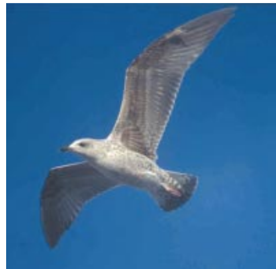
Foto 17. Geelpootmeeuw Larus michahellis 1ste winter, 30 maart 2001, Porto (Po). Veel donkerdere ondervleugel dan Pontische Meeuw (vergelijk Foto 15). De meeste Geelpootmeeuwen hebben meer tekening op ondervleugel dan dit exemplaar. Licht venster zeer onopvallend, staartband vrij smal.