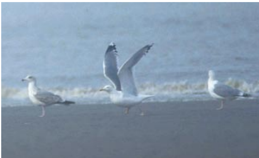
Foto 7. Pontische Meeuw Larus cachinnans adult, 30 jan 2001, Den Haan (NL). Deze vertoont een vleugelpatroon typisch voor de westelijke Pontische Meeuwen, het zogenaamde 'ponticus'-type. De lange grijze tongen (met lichtere toppen) zijn op beide vleugels zichtbaar. Handpen 10 heeft een lange witte top doordat er geen zwart bandje tussen spiegel en vleugeltop is, handpen 9 heeft nog een grote spiegel en handpen 5 heeft een brede zwarte band. (Foto: Geert Spanoghe)

gelegen gebieden. Adulte en subadulte vogels zijn zeldzaam ten noorden van de Duitse Oostzeekust.