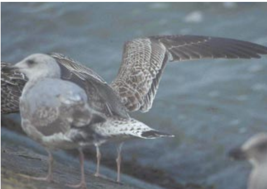
Foto 16. Geelpootmeeuw Larus michahellis juveniel, 5 september 2001 te Nieuwpoort. Halve donkere baan op grote dekveren, onduidelijk vleugelvenster, smalle contrasterende staartband met witte tippen op toppen van staartpennen wijzen op deze soort.

Michahellis vertoont in derdewinterkleed nog donkere vlekken op de ondervleugel en een weer donkerder geworden snavel. De rest van het verenkleed kan er eveneens zeer adult uitzien met nauwelijks nog enkele donkere vlekjes. Handpennen hebben minder witte tekening en handdekveren zijn nog duidelijk donkerder dan in adult kleeed.