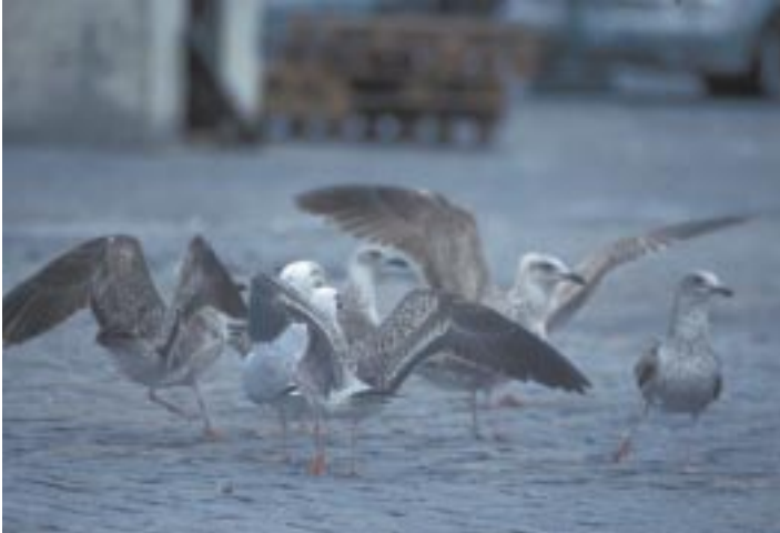
Foto 18. Kleine Mantelmeeuw Larus fuscus en Geelpootmeeuw Larus michahellis (achtergrond) 1ste winter, 30 maart 2001, Porto (Po). Bemerkt het verschil in vleugeltekening en -kleur. Kleine Mantelmeeuw heeft een zeer donkere kleur met geen venster en een volledig donkere baan op de grote dekveren.

De staartband is ook zichtbaar breder dan bij Geelpootmeeuw.