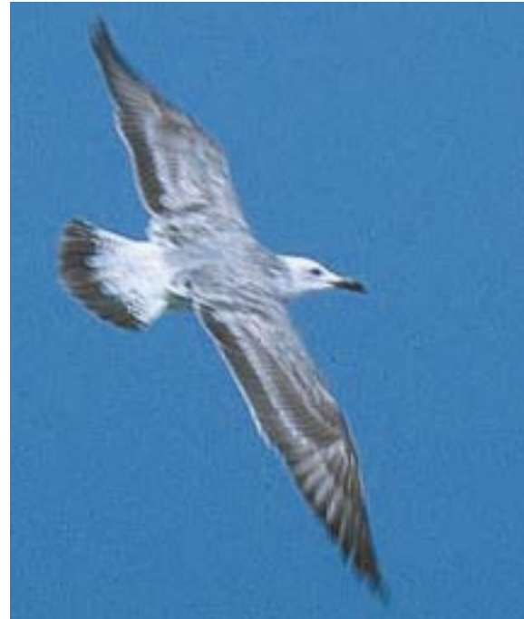
Foto 14. Pontische Meeuw Larus cachinnans 1ste winter, 27 februari 2001, Bahrain. Typisch vleugelpatroon: lichte toppen op zowel grote als middelste vleugeldekveren vormen vleugelstrepen. Vrij licht venster op binnenste handpennen. Staartband contrasteert met rest van staart en stuit.