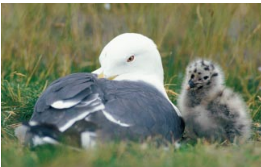
Kleine Mantelmeeuw Larus fuscus met jong

menselijke activiteiten zoals visserij, vuilstort en landbouw (o.a. Spaans 1998c, Camphuysen 1995, Camphuysen & Garthe 1999). Als ware opportunisten hebben Zilver- en Kleine Mantelmeeuw nieuwe voedselbronnen geëxploiteerd en nieuwe habitats bezet (o.a. opgespoten terreinen en daken). De sterke groei van de Vlaamse kolonies is wat later in de tijd gesitueerd dan die van de meeste buitenlandse kolonies. De aantalstoename in Vlaanderen aan het einde van de twintigste eeuw lijkt een samenspel te zijn geweest van een sterk toegenomen aanbod aan nestgelegenheden en immigratie vanuit buitenlandse kolonies. Met de uitbreiding van de voorhavens van Zeebrugge in 1986 zijn uitgestrekte en relatief rustige broedterreinen voor kustbroedvogels ontstaan. In eerste instantie waren die nog niet erg geschikt voor grote meeuwen, maar dat veranderde toen de vegetatie zich wat meer had ontwikkeld. Tegelijkertijd zijn aangrenzende populaties in Nederland en Engeland onder grote druk komen te staan. Enerzijds als gevolg van de sterk toegenomen aantallen (gebrek aan nestgelegenheden en toegenomen concurrentie) en anderzijds door het verlies aan broedgebieden waren vogels uit kolonies ten noorden van ons gedwongen om nieu-