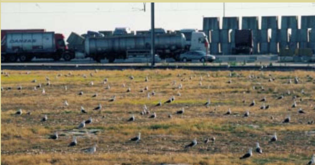
Broedkolonie van Kleine Mantelmeeuwen Larus fuscus in de voorhaven van Zeebrugge