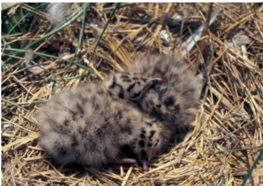
Kuikens van Zilvermeeuw Larus argentatus in het nest, voorhaven Zeebrugge

we broedgebieden te zoeken. Traditionele kolonies in de duinen van Zuid- en Noord-Holland (Nederland) zijn volledig verdwenen door de komst van de Vos Vulpes vulpes , waardoor de vogels deels op daken zijn gaan broeden en deels aansluiting hebben gezocht bij meer zuidelijke kolonies (Spaans et al. 1994). Ook in de kolonie van Orfordness in Engeland zijn er de laatste jaren problemen met de Vos (Mike Marsh in litt.). In het Nederlandse Deltagebied zijn belangrijke delen van de broedkolonies op de Maasvlakte verloren gegaan als gevolg van uitbreidingen van bedrijven. Men mag dus aannemen dat de groei van de Zeebrugse kolonies in eerste instantie het gevolg is geweest van immigratie vanuit andere kolonies, hetgeen ook wordt bevestigd door ringgegevens. Afgaande op ringaflezingen van broedende meeuwen in Zeebrugge in 2001, kan worden geconcludeerd dat in ieder geval een deel van de broedvogels aldaar afkomstig is uit kolonies in Nederland en Engeland. Van de 21 geringde Zilvermeeuwen die in 2001 als broedvogel werden vastgesteld, waren er 19 eerder in Zeebrugge als broedvogel geringd en waren er twee als pullus geringd in