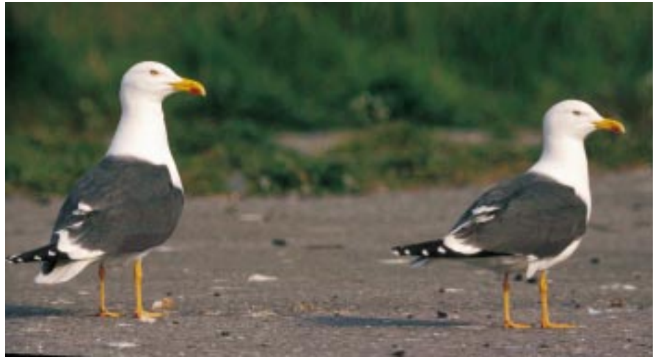
Koppel adulte Kleine mantelmeeuwen Larus fuscus , achterhaven Zeebrugge

De groei van de Vlaamse populaties lijkt nog altijd niet tot staan gebracht. In 2001 is het aantal Zilvermeeuwen met 28 % toegenomen ten opzichte van het jaar daarvoor en het aantal Kleine Mantelmeeuwen met maar liefst 126 %. Op grond van deze ontwikkeling en gezien de ogenschijnlijk goede broedresultaten van de afgelopen jaren valt te verwachten dat de aantallen de komende jaren nog verder zullen toenemen. Ook een verdere uitbreiding van het verspreidingsgebied naar het binnenland toe lijkt zich aan te kondigen. Ook kustlocaties waar nu nog veel daken onbezet zijn die in principe geschikt zijn voor meeuwen, hebben nog een flink potentieel. Daarnaast worden bij natuurontwikkelingsprojecten zoals die in de IJzermonding bij Lombardsijde nieuwe gebieden gecreëerd, die in principe geschikt zijn als broedplaats voor Zilver- en Kleine Mantelmeeuw. Daar staat tegenover dat in de haven van Zeebrugge in de nabije toekomst meer en meer van het huidige broedgebied de functie zal krijgen van bedrijfstreinen of havengebied. Wanneer inderdaad het hart van de huidige Vlaamse populaties wordt weggesneden, heeft dat mogelijk negatieve gevolgen voor de aantallen op de lange termijn en zijn de gevolgen op korte termijn niet te overzien. Waarschijnlijk zal dit leiden tot een verdere bezetting van de daken langs de kust en een toename van de overlast voor de in het havengebied gevestigde bedrijven en de omringende woonker-