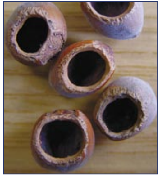
Foto 3. Door hazelmuis aangeknaagde hazelnoten.

Tijdens het zoeken naar vraatsporen vonden we in het Veursbos (Voerstreek, Vlaanderen) op een bepaald moment aangeknaagde hazelnoten van zowel hazelmuis als bosmuis die te midden van een