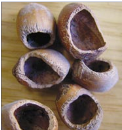
Foto 1. Door bosmuis aangeknaagde hazelnoten.

Bosmuizen Apodemus sylvaticus beginnen een hazelnoot open te knagen door er een klein gaatje in te bijten. Dat maken ze dan groter en groter