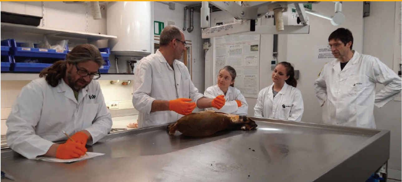
Figuur 3: Autopsie muntjak bij INBO.

In december 2018 werd in Vlaanderen bekend gemaakt dat muntjaks zijn gefokt en vrijgelaten voor de jacht 1 . Er zijn tientallen dieren aangetroffen bij twee mensen die zijn aangehouden. In 2018-2019 werden door de Vlaamse Overheid gerichte inspanningen gedaan om een verdere vestiging van muntjak in Vlaanderen tegen te gaan. Enkele vrijlevende dieren werden met gerichte acties verwijderd uit bosrijke domeinen of natuurgebieden. In het Verenigd Koninkrijk heeft een dergelijke bron geleid tot een explosief gegroeide populatie muntjaks. De British Mammal Society schat dat de dichtheid aan muntjaks al oploopt naar 100 dieren per km 2 in geschikt habitat.