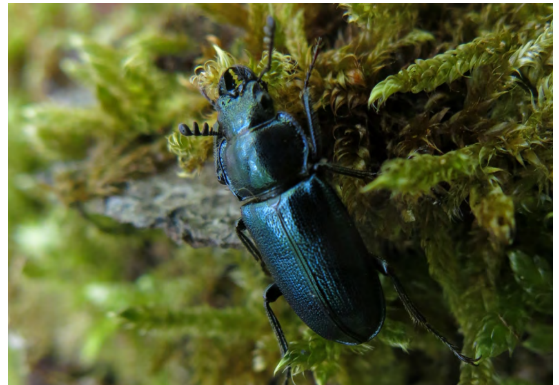
Blauw vliegend hert (Platycerus caraboides) is een kenmerkende soort voor (half)natuurlijke beukenbossen, die in het Zoniënwoud voorkomt.