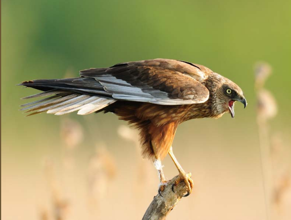
Mannetje Bruine Kiekendief

De Bruine Kiekendief 'Circus aeruginosus' staat op de Bijlage I van de Europese Vogelrichtlijn en hierdoor zijn er een aantal wettelijke verplichtingen om de soort duurzaam in stand te houden. In de eerste plaats moeten een aantal daarvoor aangeduide Vogelrichtlijngebieden garanties bieden dat de soort kan blijven voortbestaan. Maar zoals je al in vorige nummers van de Nieuwsbrief kon lezen werden in de loop van 2009 voor Vlaanderen nu ook de zogenaamde instandhoudingsdoelstellingen (IHD's) voor broedvogels van de Bijlage I van de Vogelrichtlijn opgesteld. Hierbij verbindt Vlaanderen zich om de voorgestelde doelen per soort na te streven door bescherming van gebieden maar ook door gerichte soortenbeschermingsacties. Het populatiedoel van de Bruine Kiekendief werd toen gesteld op 135 broedparen.