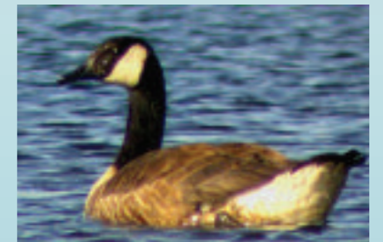
CANADESE GANS