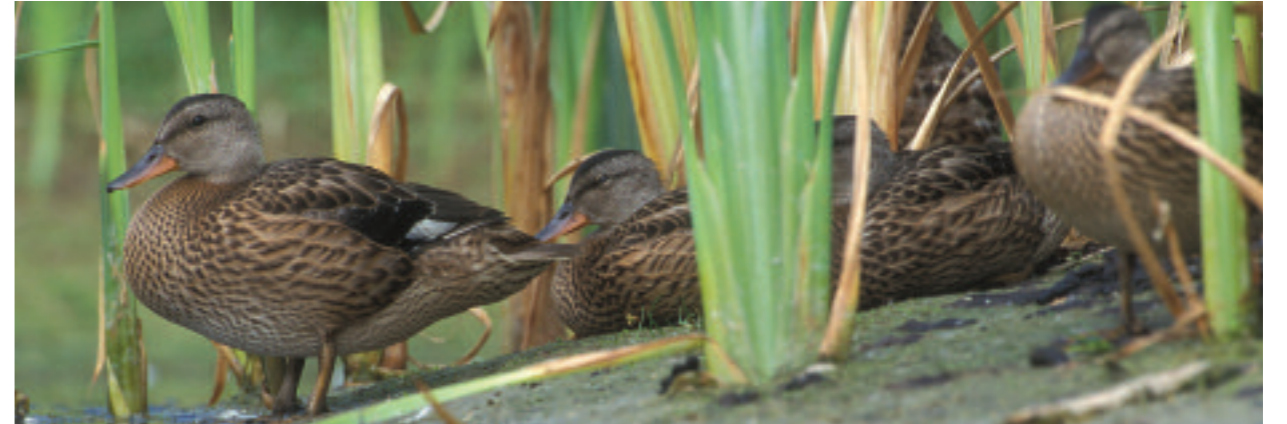
FOTO: KRAKEENDEN

genomen tussen de monding van de Rupel en de sluis van Wintam (niet mee opgenomen in de totalen). Voor de Tafeleend waren de aantallen ook deze winter spectaculair hoog. De Zeeschelde evolueerde voor deze soort van voornamelijk toevluchtsoord tijdens strenge vorstperioden (zoals in de winters 95/96 en 96/97) naar een belangrijk overwinteringsgebied dat bijna 4% van de populatie herbergt. Het aantal Kuifeenden op de Zeeschelde varieert sterk en het seizoensmaximum valt niet ieder jaar in dezelfde maand. De Bonte Strandlopers overschreden niet alleen het vorige maximum maar waren bovendien van november tot februari in grote aantallen aanwezig. Op het Groot Buitenschoor was er uitwisseling met de omliggende gebieden en verschenen grote aantallen in pieken, op de Ballooi daarentegen waren er van november tot februari bijna steeds gemiddeld 1200 exemplaren aanwezig.