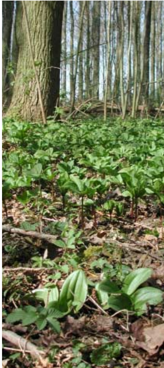
Figure 6 Paris quadrifolia and Listera ovata are two species with high requirements for habitat quality (calcareous soil) but that can bridge large distances relatively easy

grijpen heeft mogelijk het ontstaan van lokale pH-verschillen in de hand gewerkt. In veel van de oude bossen werden immers rabatten aangelegd, waarbij de oppervlakkige bodemlagen grondig verstoord werden (figuur 5). In het gebied komt veel kalkrijke kwel voor, die wordt afgevangen in de greppels en de omliggende grachten, waardoor mogelijk een hogere kalkconcentratie in de greppels voorkomt. Anderzijds werden vanaf 1930 verschillende pompstations in het gebied geïnstalleerd, wat zorgde voor een merkbare verdroging (Verstraeten & De Smet, 1999; Baeté, 2006a). Daardoor is de invloed van opgestuwd regenwater toegenomen, wat vooral op de hoger gelegen ruggen plaatselijk tot verzuring kan hebben geleid. Analyse van meerdere bodemstalen per bosfragment, waarbij onderscheid wordt gemaakt tussen greppels en ruggen, is evenwel nodig om deze hypothese te bevestigen.