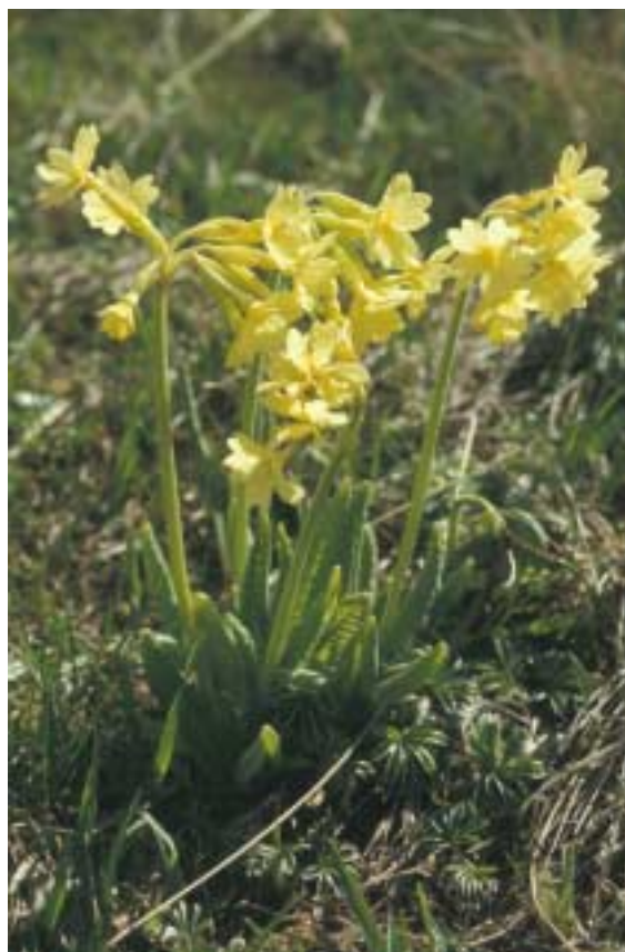
slanke sleutelbloem

In sommige oudere bosjes met rabatten werd vastgesteld dat Eenbes zeer frequent voorkomt, waarbij duizenden individuen plaatselijk bijna de ganze bodem bedekken (figuur 6). Daartussen groeit – vaak talrijk – Grote keverorchis. Het feit dat deze twee soorten plaatselijk zo massaal