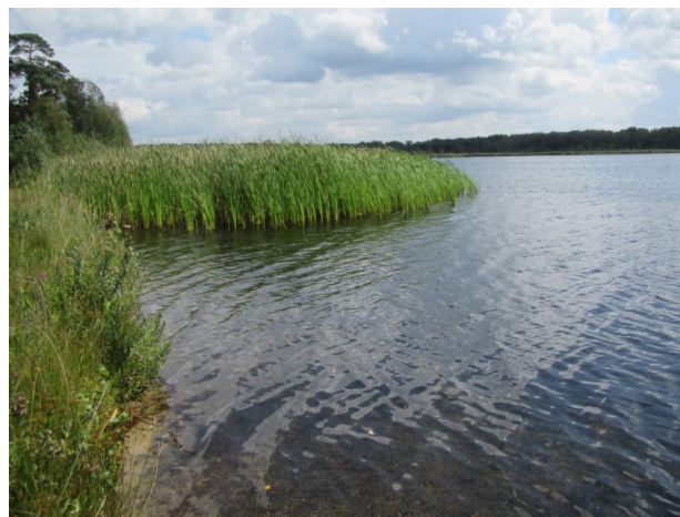
Figuur 3. Ronde Put (Mol-Postel, 27.08.2014).