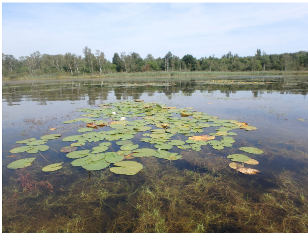
Figuur 2. Grote Sprietput (Mol-Postel, 23.08.2019).

In het water bleven, naast wat Isolepis fluitans , Pilularia globulifera en Potamogeton gramineus , enkel de kranswieren Chara virgata en Nitella translucens in beperkte mate aanwezig. Dat betekent echter niet dat N. confervacea inmiddels uit Vlaanderen verdwenen zou zijn of opnieuw herleid tot een cryptisch bestaan. In 2014 werd immers een grote populatie waargenomen in het westelijk deel van de Ronde Put te Mol-Postel (IFBL B6.53.42), in het Kempens deel van de provincie Antwerpen, en meer recent bleek ze ook aanwezig te zijn in de Grote Sprietput, eveneens in Mol-Postel (IFBL C6.14.34) (Fig. 1). Een update met een korte bespreking van de nieuwe vindplaatsen is daarom op zijn plaats.