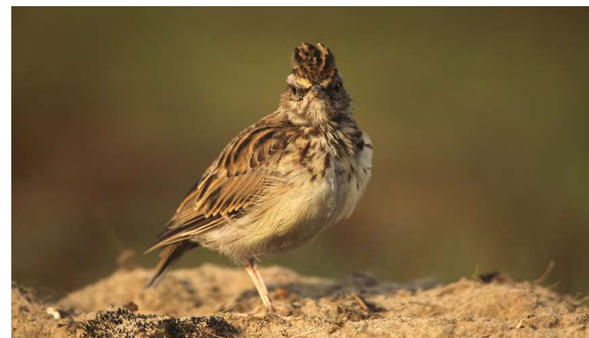
Boomleeuwerik profiteert volop van het in grote heidegebieden gevoerd natuurbeheer waar vaak wordt ingezet op heideherstel in verboste delen van het terrein. De ontstane open plekken worden meestal snel door deze soort gekoloniseerd. In een later stadium profiteert ook Nachtzwaluw van dat beheer. - Glenn Vermeersch