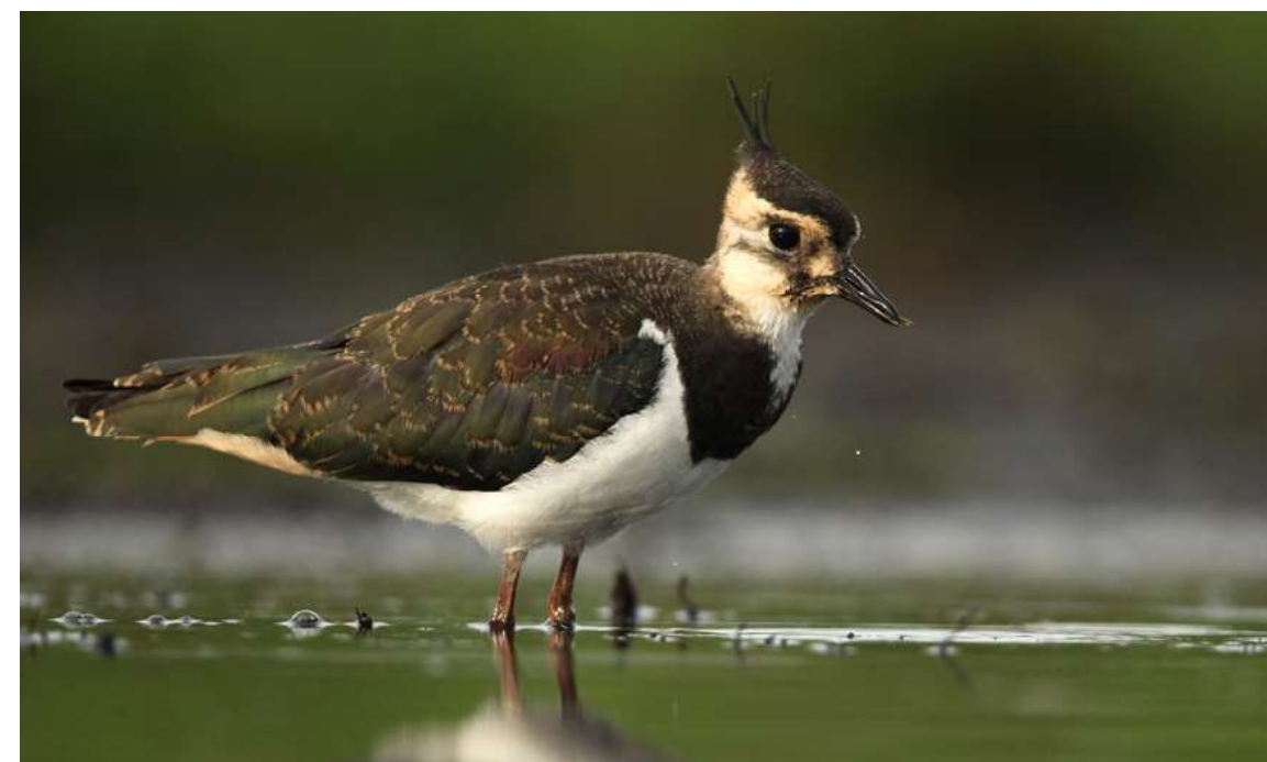
Kenmerkend voor de malaise in de open landbouwgebieden is de fors dalende trend (-59%) van Kievit - Glenn Vermeersch