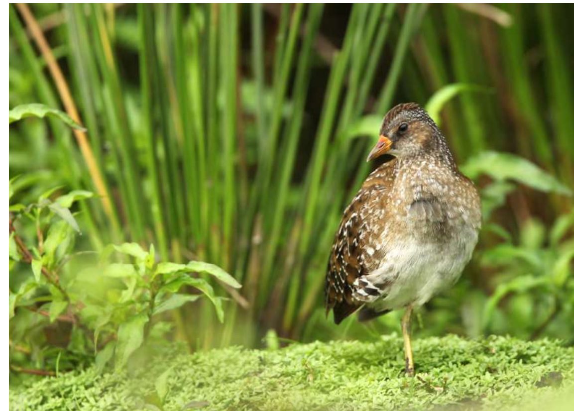
Porseleinhoen kan in de toekomst hopelijk profiteren van de uitvoer van het specifieke soortbeschermingsplan. Door de nog deels uit te voeren Sigma-natuurinrichting zullen ongetwijfeld nieuwe, voor de soort geschikte locaties in onze riviervalleien ontstaan - Glenn Vermeersch